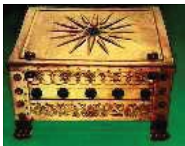
5. Χρυσή λάρνακα με το έμβλημα των Μακεδόνων βασιλιάδων (Βεργίνα, κτίριο προστασίας βασιλικών τάφων)

Ο Αλέξανδρος σ' ένα λόγο του λέει στους Μακεδόνες: