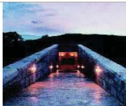
6. Οι βασιλικοί τάφοι που ανακαλύφθηκαν στη Βεργίνα.

Πάπυρος Λαρούς Μπριτάνικα, τόμος 14ος, σ. 91 - 92