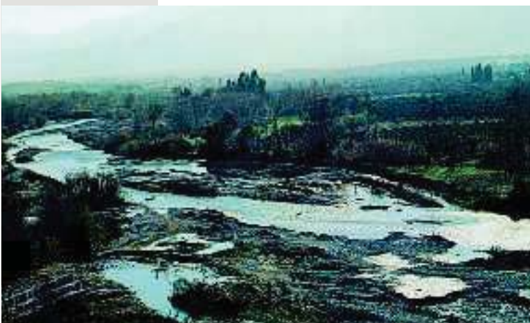
1. Η κοιλάδα του Ευρώτα

Οι Δωριείς κυριάρχησαν με τη δύναμή τους σε διάφορα μέρη της Πελοποννήσου. Πολλοί από