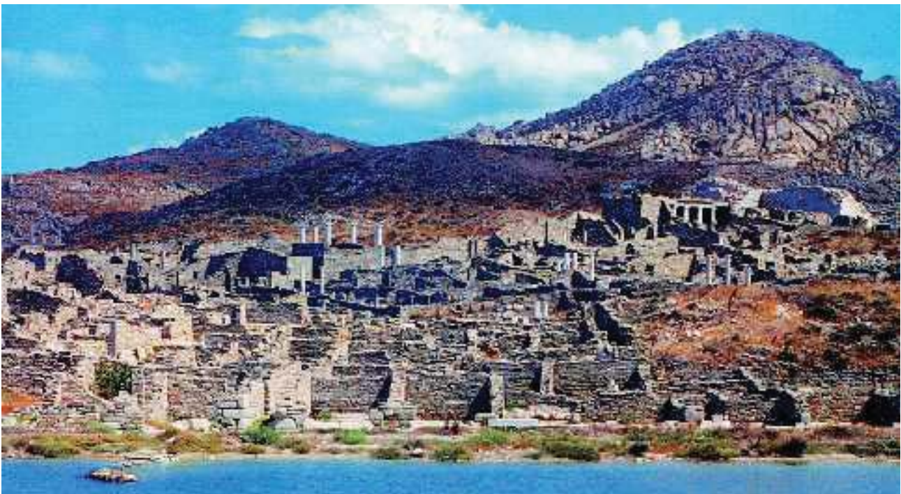
2. Ο αρχαιολογικός χώρος της Δήλου. Στο ναό του Απόλλωνα συγκεντρώνονταν οι αντιπρόσωποι των πόλεων.

Η Σπάρτη, βλέποντας τη δύναμη της Αθήνας να μεγαλώνει, θέλησε να πάρει με το μέρος της τις δυσαρεστημένες πόλεις.