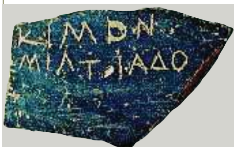
4. Όστρακο στο οποίο είναι γραμμένο το όνομα του Κίμωνα (Αθήνα, Μουσείο Αγοράς).

Κάποτε λένε πως ήρθε στην Αθήνα κάποιος Ροισάκης από την Περσία. Αυτός είχε πολλά λεφτά και φοβήθηκε μην του τα πάρουν. Ζήτησε λοιπόν την προστασία του Κίμωνα. Γι' αυτό πήγε στο σπίτι του και άφησε στην αυλόπορτα δύο δοχεία με ασημένια και χρυσά νομίσματα. Ο Κίμωνας, όταν τα είδε, χαμογέλασε και ρώτησε το Ροισάκη τι ήθελε να τον έχει, φύλακα ή φίλο του. Εκείνος λοιπόν του απάντησε πως ήθελε να τον έχει φίλο του. Τότε ο Κίμωνας του είπε να τα πάρει μαζί του και να φύγει, γιατί, μια που έγινε φίλος του, θα έχει στη διάθεσή του τα χρήματά του, όποτε τα χρειαστεί.