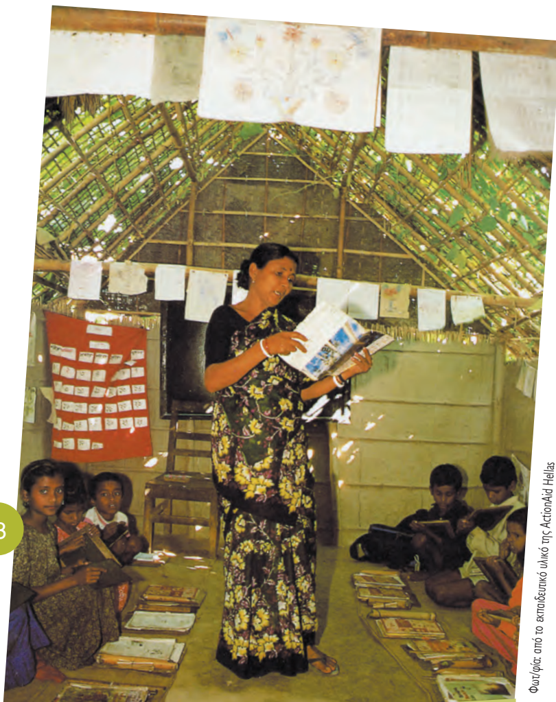
Φωτό/φίς από το εκπαιδευτικό υλικό της ActionAid Hellas

3 Να και ένα σχολείο στο Μπανγκλαντές. Τα παιδιά έχουν στολίσει την τάξη τους.