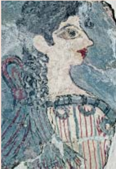
6. Η Παριζιάνα (τοιχογραφία).