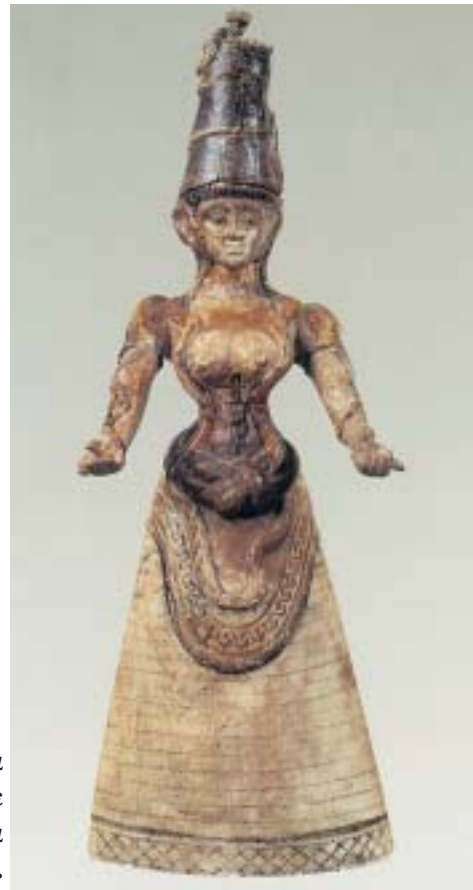
8. Γυναικεία θεότητα με πλούσια ενδυμασία.