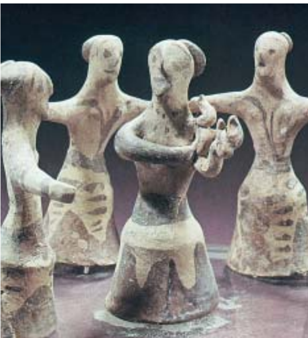
1. Μινωίτισσες που χορεύουν.

Τα παιδιά των Μινωιτών γυμνάζονταν από μικρά. Έπαιζαν, όπως και τα σημερινά παιδιά, κυνηγητό και πάλη αλλά και παιχνίδια επιτραπέζια, όπως το ζατρίκιο , που μοιάζει με το σημερινό σκάκι, πεσσούς και αστραγάλους.