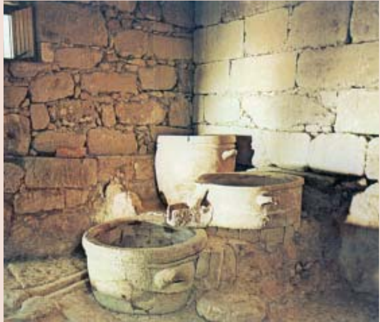
Πατητήρι σταφυλιών της μινωικής εποχής.

Το κρασί είναι για μας πολύτιμο υγρό. Συχνά το προσφέρουμε στη θεά, τα δε ανάκτορα το εξάγουν σε μεγάλες ποσότητες μέσα σε πιθάρια.