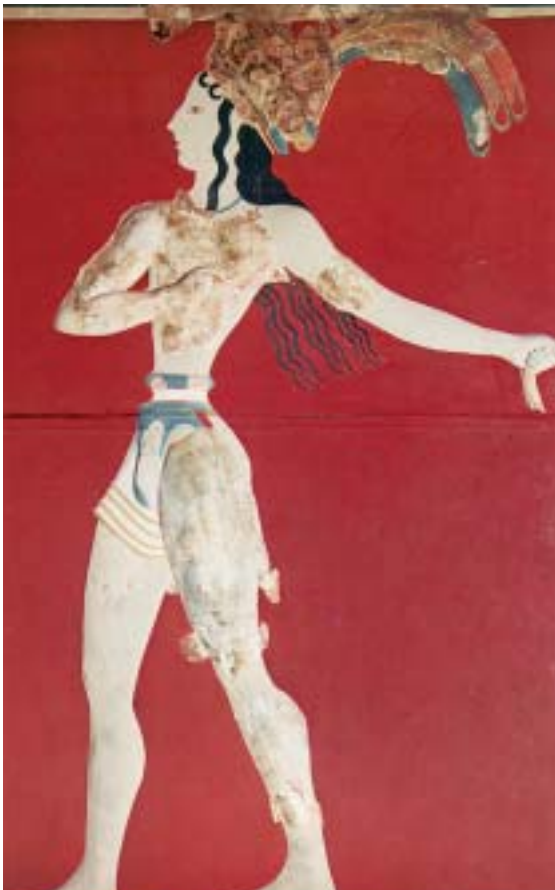
7. Ο πρίγκιπας με τα κρίνα (τοιχογραφία).

Ν. Τζώρτζογλου, Όταν οργίζεται η γη , σελ. 112