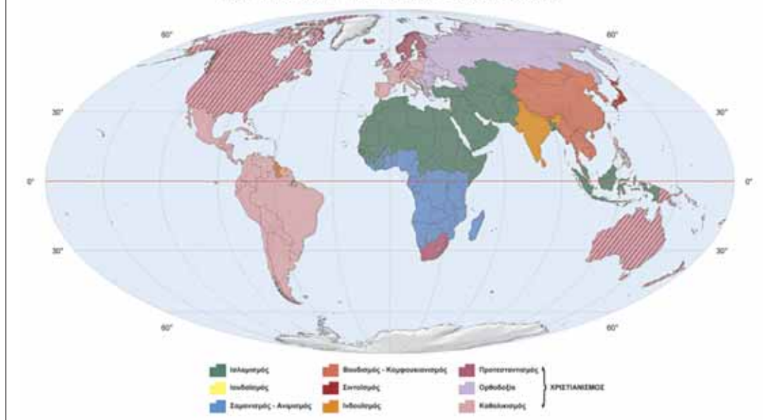
ΟΙ ΘΡΗΣΚΕΙΕΣ ΣΤΟΝ ΚΟΣΜΟ (Κατανομή με βάση την επικρατούσα ανά χώρα θρησκεία)