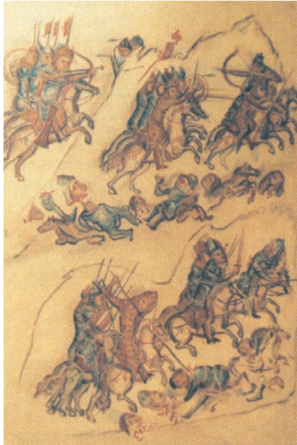
2. Η διπλωματία «των ξένων όπλων»: Το ιππικό των Ρώσων κυνηγά τους Βούλγαρους. Η εικόνα αναφέρεται στην περίοδο που οι Ρώσοι συνεργάστηκαν με τους Βυζαντινούς εναντίον των Βουλγάρων (δες κεφάλαιο 22). (Μικρογραφία από βουλγαρικό χειρόγραφο, Βιβλιοθήκη Βατικανού)