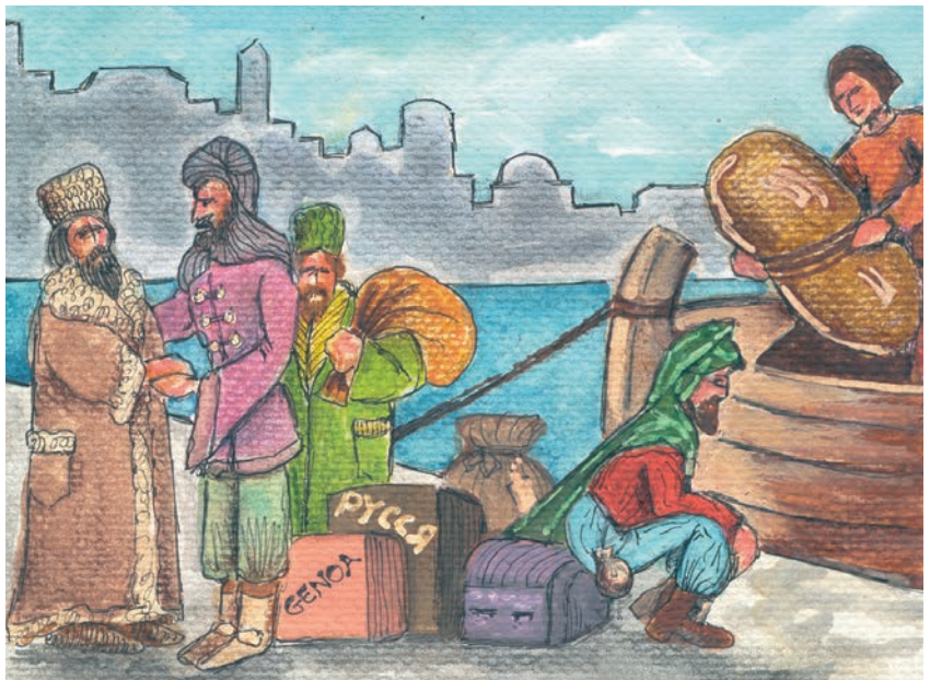
1. Οι Βυζαντινοί προστάτευαν τους ξένους εμπόρους.

Την Κωνσταντινούπολη επισκέπτονταν ακόμη άνθρωποι