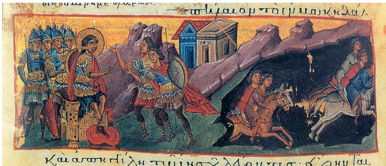
1. Βυζαντινοί φρουροί των συνόρων. Οι φρουρές αυτές στα χρόνια της παρακμής αποδιοργανώθηκαν. (μικρογραφία χειρογράφου, Ι.Μ. Βατοπεδίου, Άγιο Όρος)

Σε ιδιαίτερα δύσκολη θέση βρέθηκαν και οι κάτοικοι των ακριτικών περιοχών, που δεν μπο-