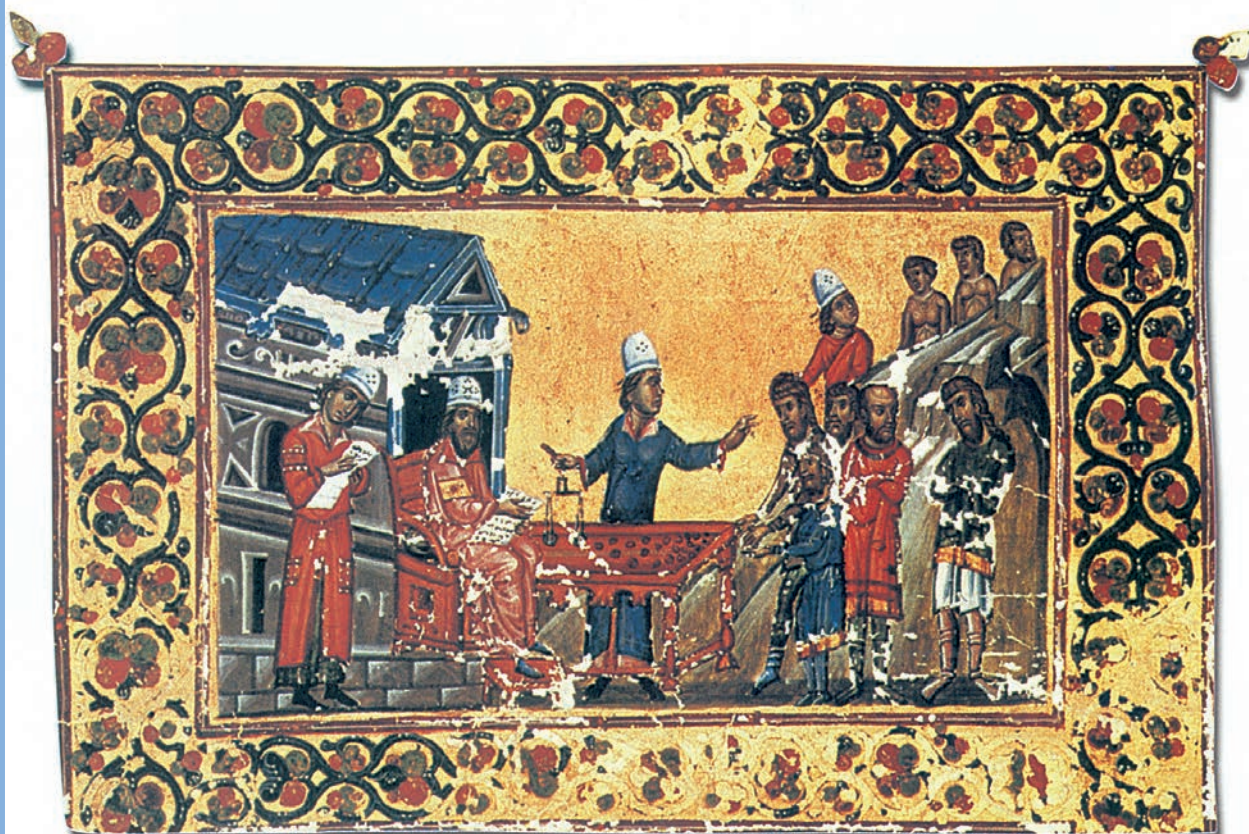
4.α. Βυζαντινός φορολόγος εισπράττει χρήματα από τους οφειλότες. (Μικρογραφία από βυζαντινό χειρόγραφο, Ι. Μ. Αγ. Αικατερίνης, Σινά)