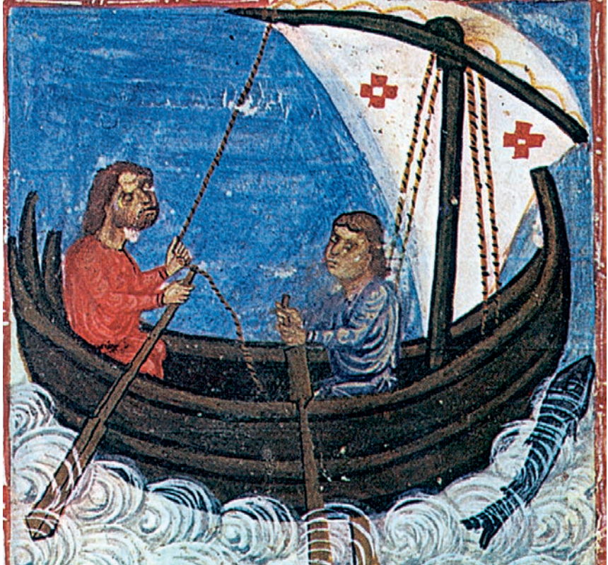
2. Τα βυζαντινά καράβια σταμάτησαν το εμπόριο, μετά την παραχώρηση προνομίων στους Βενετούς. (Μικρογραφία, Πατριαρχική βιβλιοθήκη Ιεροσολύμων)