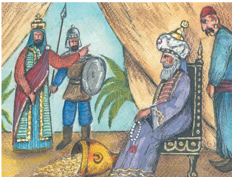
3.α. Οι Βυζαντινοί απορρίπτουν τις προτάσεις του Άραβα Χαλίφη της Βαγδάτης.