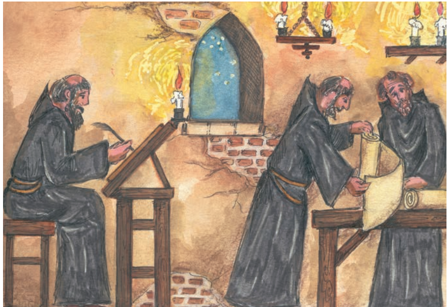
4.α. Βυζαντινοί μοναχοί αντιγράφουν αρχαία κείμενα.