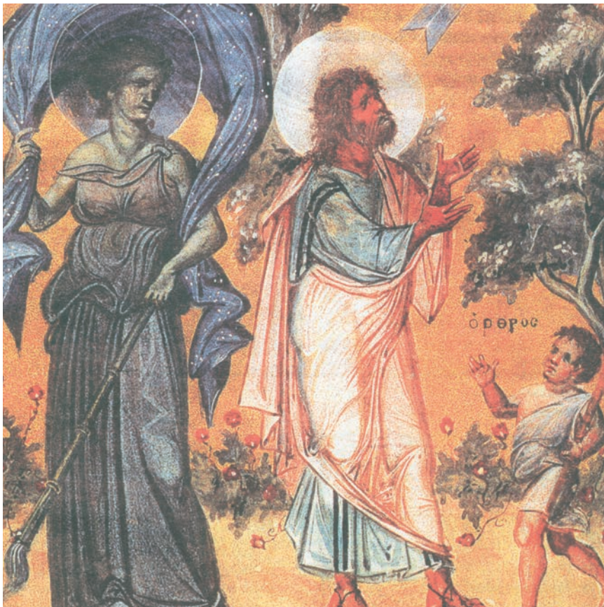
5. Ο Προφήτης Ησαΐας, η Νύχτα και ο Όρθρος. (Παρίσι, Εθνική Βιβλιοθήκη)

Χαρακτηριστικό δείγμα τέχνης της Μακεδονικής Αναγέννησης, όπου υπάρχουν θέματα από την αρχαιότητα και τη φύση.