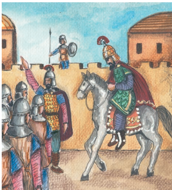
5. Οι Μακεδόνες αυτοκράτορες οργάνωσαν αξιόμαχο στρατό.