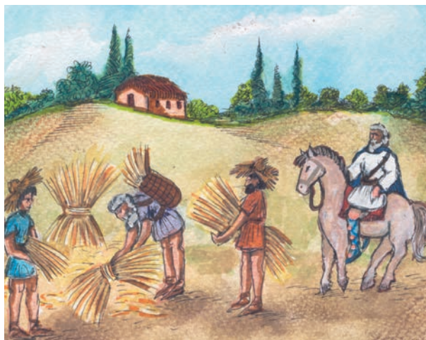
3. Δυνατός μεγαλοκτηματίας επιβλέπει τον θερισμό των κτημάτων του.

Κωνσταντίνος Πορφυρογέννητος, Νεαρά (Μάρτιος 947 μ.Χ.)