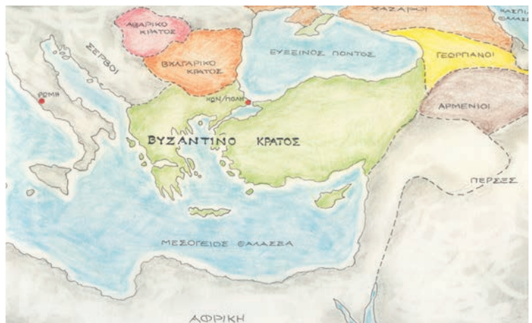
1. Χάρτης της αυτοκρατορίας στα χρόνια των Μακεδόνων.