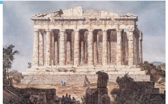
3.α. Ο Παρθενώνας στα βυζαντινά χρόνια λειτούργησε ως ναός της Παναγίας της Αθηνιώτισσας.

Γεώργιος Κεδρηνός, Σύντομη Ιστοριών (11ος αιων.)