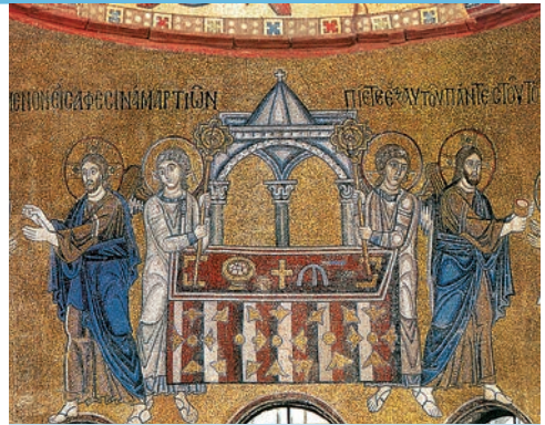
5.α. Η Κοινωνία των Αποστόλων. (Ψηφιδωτή εικόνα από την Αγία Σοφία του Κιέβου)

Λίγα χρόνια αργότερα, ο εγγονός της και διάδοχος Βλαδίμηρος, ο Μέγας, παντρεύτηκε την αδελφή του αυτοκράτορα Βασιλείου Β΄, Άννα, αφού πρώτα ο ίδιος και πλήθος υπήκοοί του, βαπτίστηκαν Χριστιανοί.