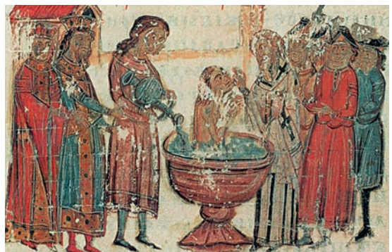
1. Το βάπτισμα του Βόγορη – Μιχαήλ. Μικρογραφία από βουλγαρικό χειρόγραφο (Βιβλιοθήκη Βατικανού)

Λίγα χρόνια αργότερα οι Βούλγαροι, με αρχηγό τον Σαμουήλ , επιτέθηκαν ξανά κι έκαναν φοβερές καταστροφές στις ελληνικές περιοχές, φτάνοντας ως την Πελοπόννησο. Ακολούθησαν σκληρές και μακροχρόνιες συγκρούσεις ανάμεσα στους δυο στρατούς. Ο βυζαντινός στρατηγός Νικηφόρος Ουρανός τους αντιμετώπισε νικηφόρα στον Σπερχειό ποταμό και ο αυτοκράτορας Βασίλειος ο Β΄ συνέτριψε τον στρατό τους στα στενά του Κλειδιού της Μακεδονίας,