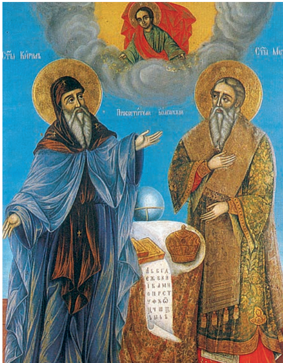
2.α. Οι άγιοι Κύριλλος και Μεθόδιος.

Ο Κύριλλος και ο Μεθόδιος ήταν γιοι σεβαστής οικογένειας, που ζούσε στη Θεσσαλονίκη. Ο Κύριλλος ήταν μεγαλύτερος και γεννήθηκε γύρω στα 822 μ.Χ. και τον ονόμασαν Κωνσταντίνο. Και οι δύο