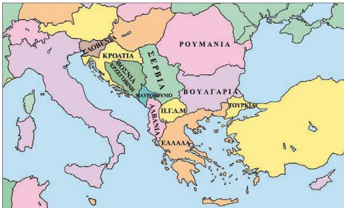
Εικόνα 7.3: Πολιτικός χάρτης Βαλκανικής Χερσονήσου

Στον παρακάτω χάρτη βρείτε τα κράτη της Βαλκανικής χερσονήσου, με τα οποία συνορεύει η χώρα μας και ορίστε τη θέση της Ελλάδας στη χερσόνησο αυτή. Ποια μεγάλη θάλασσα βρέχει τη νότια πλευρά της χώρας μας;