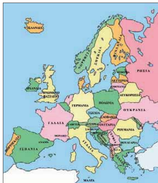
Εικόνα 7.2: Πολιτικός χάρτης της Ευρώπης

Παρατηρώντας το διπλανό χάρτη ας καθορίσουμε τη γεωγραφική θέση της Ελλάδας στην Ευρώπη.