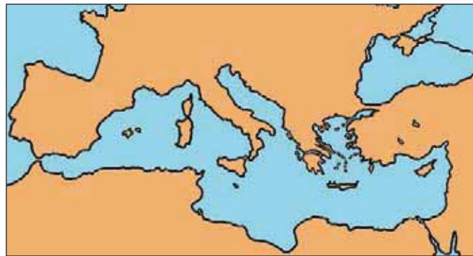
Εικόνα 6.2: Η Ελλάδα στον κόσμο και στην περιοχή της Μεσογείου