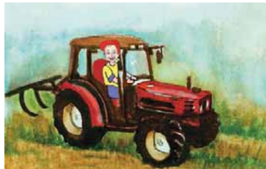
Εικόνα 36.3β: Σύγχρονος τρόπος καλλιέργειας της γης