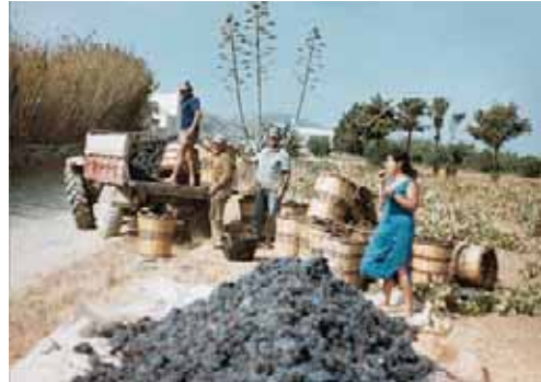
Εικόνα 36.2: Τρύγος στην Πάρο

Τα κυριότερα αγροτικά προϊόντα που παράγονται στη χώρα μας είναι: δημητριακά, ελιές-λάδι, σταφύλια-κρασί, εσπεριδοειδή, βιομηχανικά φυτά (καπνά, βαμβάκι, τεύτλα), λαχανικά. Πολλά από αυτά οι αγρότες μας με τη χρήση σύγχρονων μηχανημάτων τα τυποποιούν και τα εξάγουν και σε άλλες χώρες. Οι οργανωμένες εξαγωγές αγροτικών προϊόντων βοηθούν πολύ στην ανάπτυξη της ελληνικής οικονομίας.