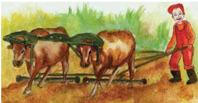
Εικόνα 36.3α: Παλιός τρόπος καλλιέργειας της γης

Το κράτος, για να αντιμετωπίσει αυτά τα προβλήματα, έχει δημιουργήσει οργανωμένες υπηρεσίες, όπως είναι η Πανελλήνια Συνομοσπονδία Ενώσεων Αγροτικών Συνεταιρισμών (ΠΑΣΕΓΕΣ), το Υπουργείο Αγροτικής Ανάπτυξης και Τροφίμων, η Αγροτική Τράπεζα, ο Οργανισμός Γεωργικών Ασφαλίσεων (Ο.Γ.Α.) κ.ά., οι οποίες βοηθούν οικονομικά και συμβουλευτικά τους αγρότες.