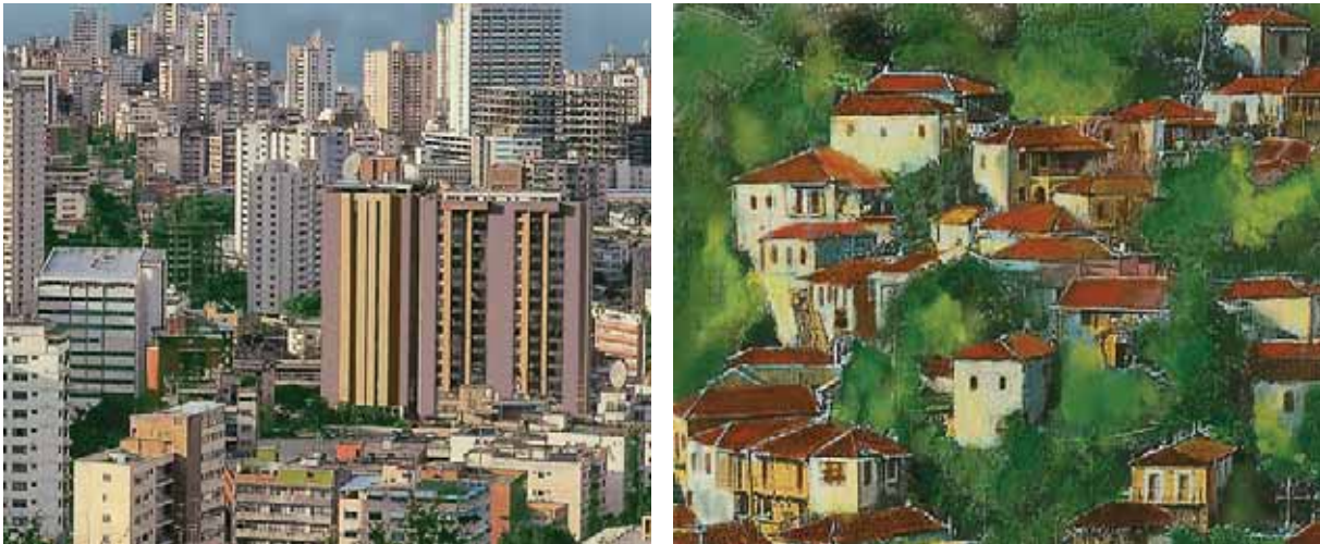
Εικόνα 30.2: Περιοχές με διαφορετική κατανομή πληθυσμού

Οι παράγοντες, οι οποίοι διαμορφώνουν την κατανομή του πληθυσμού στην πατρίδα μας, είναι κυρίως φυσικοί (ορεινά ή πεδινά εδάφη, κλιματικές συνθήκες κ.ά.) και οικονομικοί (εργασία, συγκοινωνίες, περισσότερες ανέσεις κ.ά.). Το μεγαλύτερο μέρος του πληθυσμού συγκεντρώνεται στα πεδινά, όπου μπορούν να πραγματοποιηθούν οι περισσότερες ανθρώπινες δραστηριότητες και επομένως να αναπτυχθεί η οικονομία. Οι άνθρωποι βρίσκουν εργασία, αυξάνουν το εισόδημά τους και απολαμβάνουν τις υπηρεσίες που παρέχονται από το κράτος. Κατασκευάζονται με μεγαλύτερη ευκολία έργα υποδομής, όπως δρόμοι, γέφυρες, λιμάνια και αεροδρόμια, κτίζονται μεγάλα νοσοκομεία και σχολεία, ιδρύονται βιομηχανικές μονάδες.