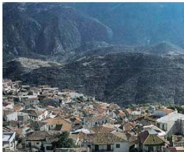
Εικόνα 30.4: Αράχωβα