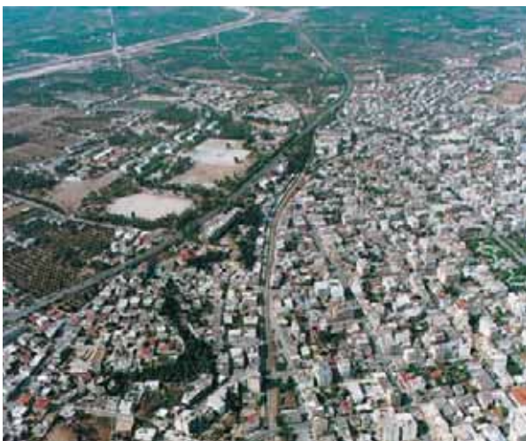
Εικόνα 30.3: Η Κόρινθος από ψηλά

Υποθέστε ότι είστε υπάλληλοι του Υπουργείου Εσωτερικών Δημόσιας Διοίκησης και Αποκέντρωσης (ΥΠ.ΕΣ.Δ.Δ.Α.). Ποια διαφορετικά προβλήματα καλείστε να επιλύσετε σε κάθε μία από αυτές τις περιοχές;