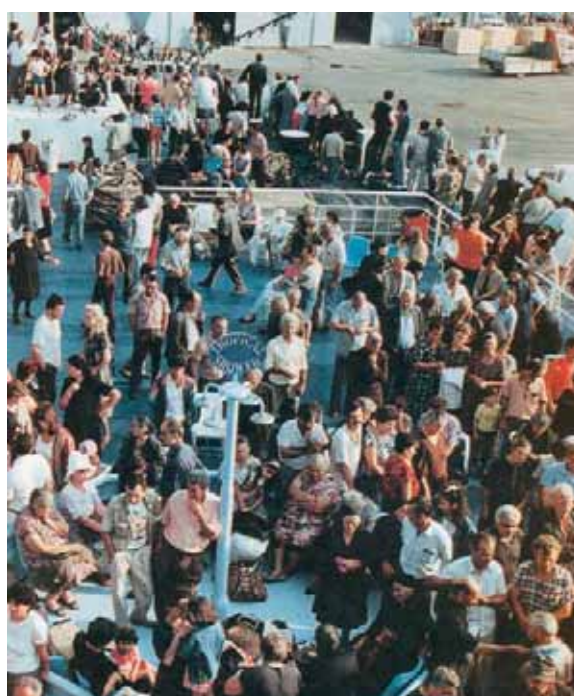
Εικόνα 29.2: Έλληνες πρόσφυγες από τη Γεωργία

Πολύ σημαντικοί παράγοντες της εξέλιξης του πληθυσμού είναι οι γεννήσεις και οι θάνατοι που συμβαίνουν. Στη χώρα μας τα τελευταία χρόνια ο αριθμός των γεννήσεων είναι μικρότερος από τον αριθμό των θανάτων, με αποτέλεσμα να επηρεάζεται αρνητικά ο πληθυσμός και να δημιουργείται έντονο δημογραφικό πρόβλημα . Ωστόσο, ενώ θα έπρεπε να έχουμε μείωση του πληθυσμού εξαιτίας της μείωσης των γεννήσεων, αντίθετα έχουμε αύξηση του πληθυσμού.