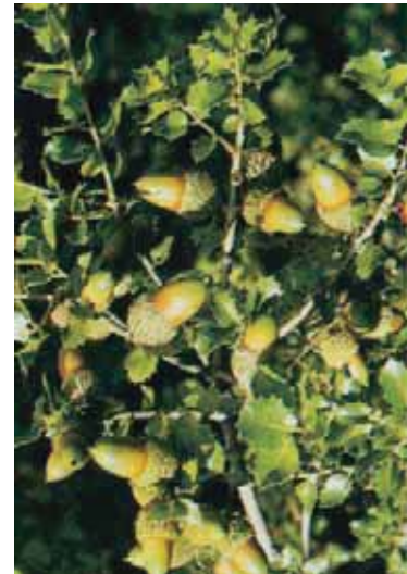
Εικόνα 23.2β: Πουρνάρι