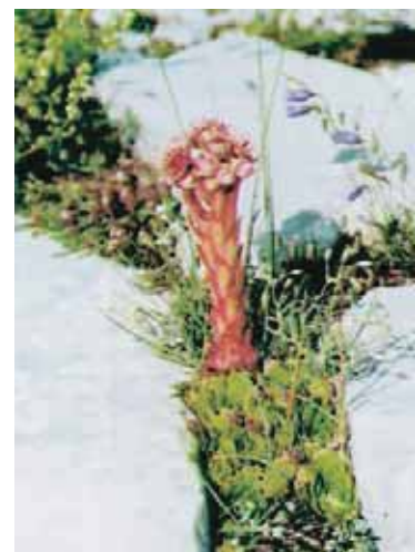
Εικόνα 23.2γ: Αμάραντος (φυτρώνει σε υψόμετρο μεγαλύτερο από 2.000μ.)