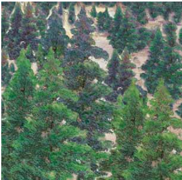
Εικόνα 23.1α: Περιοχή με πλούσια βλάστηση