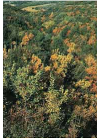
Εικόνα 23.2α: Μεσογειακοί θαμνώνες

Τη συναντάμε στα υψηλά όρη της χώρας μας και σε υψόμετρα από 1.700 έως 2.900 μ.. Αποτελείται από πωώδη κυρίως βλάστηση, με διάσπαρτους μικρούς θάμνους, όπως η ξεραγκαθιά και πολλά είδη από πανέμορφα αγριολούλουδα.