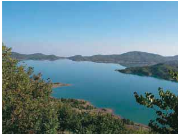
Εικόνα 20.3: Η λίμνη Ταυρωπού (Πλαστήρα)

Λίμνη των Ιωαννίνων (Παμβώτιδα), η λίμνη της κυρα-Φροσύνης: Στα νερά της καθρεφτίζεται η όμορφη και ιστορική πόλη των Ιωαννίνων. Θρύλοι και παραδόσεις του λαού μάς μιλάνε για τη λίμνη αυτή. Στα παγωμένα νερά της περπάτησε ο τούρκος πασάς Τουραχάν νομίζοντας ότι είναι μια χιονισμένη πεδιάδα χωρίς δέντρα. Επίσης είναι γνωστή για τον πνιγμό της κυρα-Φροσύνης από τον Αλή Πασά.