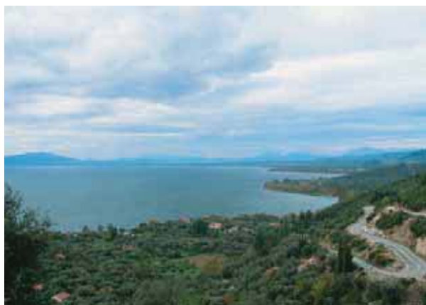
Εικόνα 20.1α: Η λίμνη Τριχωνίδα