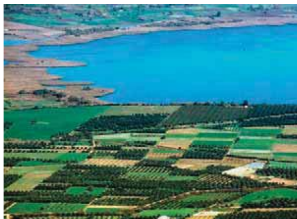
Εικόνα 20.1β: Η λίμνη Λυσιμαχία

«Ο δρόμος του Βραχωρίου περνάει ανάμεσα στις δύο τούτες λίμνες, την Τριχωνίδα και τη Λυσιμαχία. Το ταξίδι, την άνοιξη ιδίως, έχει απεριόριστη γοητεία. Τα νερά είναι σκεπασμένα από πλήθος ανθισμένα νούφαρα, από πυκνούς στοίχους καλάμια. Η καρδιά ξεκουράζεται σε μία γαλήνη χωρίς τέλος...»