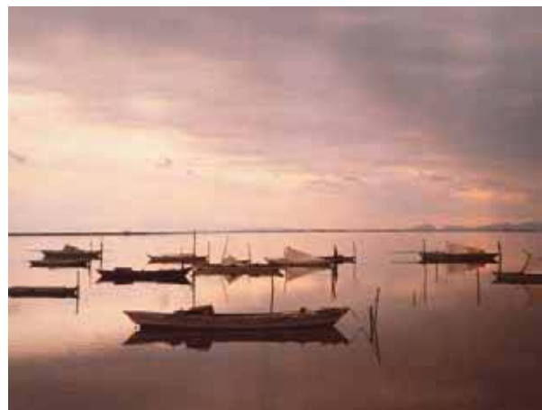
Εικόνα 20.4: Η Λιμνοθάλασσα του Μεσολογγίου

Η λιμνοθάλασσα αυτή αποτελεί ένα από τα πλουσιότερα ελληνικά ιχθυοτροφεία. Οι κάτοικοι της περιοχής με καλαμωτές εκτρέφουν κέφαλους, λαυράκια και τσιπούρες, είναι δε γνωστή και για το αυγοτάραχο που παράγεται από τους κέφαλους.