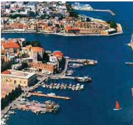
Εικόνα 17.4: Ενετικό λιμάνι Χανίων

Ας βρούμε μαζί το υψόμετρο (την απόσταση από τη θάλασσα) και τις ειδικές τοπικές συνθήκες που διαμορφώνουν αυτά τα χαρακτηριστικά.