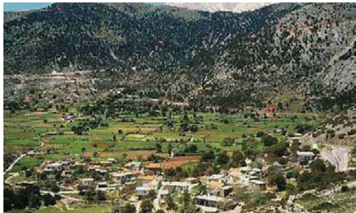
Εικόνα 17.5: Οροπέδιο Ασκύφου

«Φτάσαμε ανήμερα τα Χριστούγεννα στη Σούδα, το ξακουστό λιμάνι των Χανίων. Ήταν ένα γλυκό πρωινό, χωρίς κρύο και αέρα κι όταν ο ήλιος ανέβηκε λιγάκι, βγάλαμε τα πανωφόρια στον περίπατό μας στο γραφικό παλιό Βενετσιάνικο λιμάνι της πόλης. Ανεβαίνοντας με τ' αυτοκίνητο πια προς το ορεινό λεκανοπέδιο του Ασκύφου, βλέπαμε γύρω μας τα Λευκά Όρη ... κατάλευκα και φθάνοντας στ' Αμμουδάρι, σε υψόμετρο 730 μέτρα γέμισαν τα μάτια μας νιφάδες του χιονιού. Στον έρημο δρόμο του καπνισμένου απ' τα τζάκια χωριού τρέχαμε, γιατί μας κυνηγούσε το κρύο. Κι ύστερα στον παλιό καφεéné ζεστάναμε τα χέρια στο μαγκάλι κι ήπιαμε την κερασμένη τσικουδιά με ελιές και βρεμένο παξιμάδι».