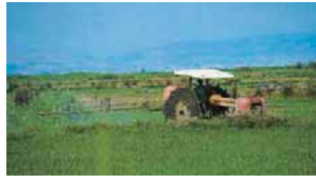
Εικόνα 15.γ: Γεωργική εργασία

Στην πατρίδα μας παρατηρούμε ότι η ανάπτυξη γεωργικών εργασιών πραγματοποιείται στις πεδινές εκτάσεις. Εκεί έχουν αναπτυχθεί οι μεγαλύτερες αγροτικές πόλεις, των οποίων οι κάτοικοι έχουν τη δυνατότητα να καλλιεργούν με σύγχρονα μηχανήματα. Μπορούν επίσης να μεταφέρουν τα προϊόντα τους στα κοντινά εργοστάσια ή στις μεγάλες πόλεις με σύγχρονα συγκοινωνιακά μέσα.