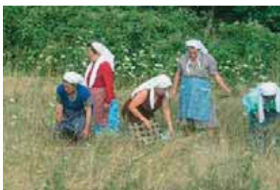
Εικόνα 15.1β: Αλώνισμα

Η Ελλάδα, όπως γνωρίζουμε, είναι ορεινή χώρα. Πολλοί κάτοικοι είναι υποχρεωμένοι να ζουν σε περιοχές, όπου οι συγκοινωνίες γίνονται με δυσκολία και πολλές φορές το χειμώνα σταματούν για αρκετές ημέρες. Τις ημέρες αυτές δύσκολα αντιμετωπίζονται προβλήματα που σχετίζονται με την υγεία, τη διατροφή των κατοίκων και των ζώων, την ενημέρωση και την επικοινωνία γενικότερα.