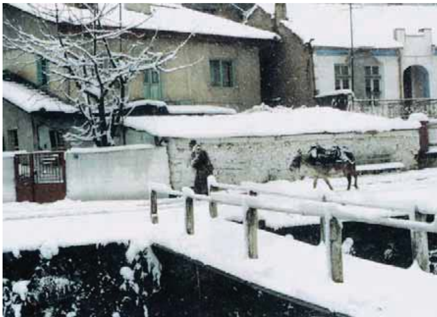
Εικόνα 15.1α: Μια χειμωνιάτικη μέρα στη Φλώρινα