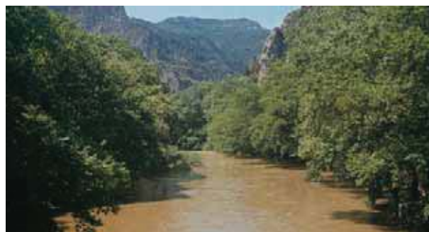
Εικόνα 14.4: Κοιλάδα των Τεμπών

Σε πολλά μέρη της πατρίδας μας μπορούμε να δούμε μαγευτικές περιοχές που απλώνονται ανάμεσα σε βουνά και τις διασχίζει ένας ποταμός. Εκεί συναντά κανείς καταπράσινα τοπία, όπου η φύση προσφέρει μοναδικές εμπειρίες. Είναι οι κοιλάδες.