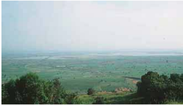
Εικόνα 14.2: Η πεδιάδα του Έβρου

Οι κυριότερες πεδιάδες της Ελλάδας είναι δύο. Η μεγαλύτερη είναι αυτή που απλώνεται στην περιοχή Θεσσαλονίκης – Γιαννιτσών και φθάνει μέχρι τη θάλασσα του Θερμαϊκού κόλπου. Είναι μια παράλια πεδιάδα . Είναι εύφορη, παράγει πολλά προϊόντα και οι αγρότες ασχολούνται αποκλειστικά με την καλλιέργεια της γης. Οι μεγάλοι ποταμοί που διασχίζουν την πεδιάδα, ο Αλιάκμονας, ο Αξιός, ο Λουδίας και ο Γαλλικός, την ποτίζουν και μεταφέροντας εύφορες ύλες την κάνουν περισσότερο παραγωγική.