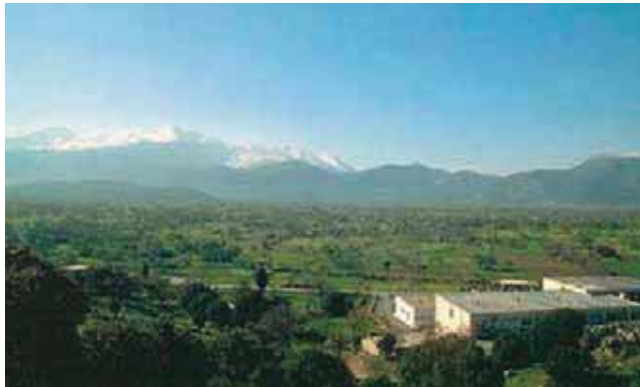
Εικόνα 14.3 : Το οροπέδιο του Λασιθίου

Η δεύτερη μεγάλη πεδιάδα είναι η Θεσσαλική. Είναι μια εύφορη πεδινή έκταση, που περιβάλλεται από βουνά και αρδεύεται από τον Πηνειό ποταμό. Ο Πηνειός περνώντας μέσα από την κοιλάδα των Τεμπών εκβάλλει στο Αιγαίο. Η Θεσσαλική πεδιάδα χαρακτηρίζεται ως ηπειρωτική ή εσωτερική .