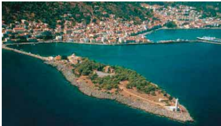
Εικόνα 12.2: Γύθειο

Ας συζητήσουμε γιατί οι ηπειρωτικές πόλεις από την αρχαιότητα έως και σήμερα νιώθουν την ανάγκη της στενής συμμαχίας-συνεργασίας με μια πόλη παραθαλάσσια, δηλαδή με το επίνειό τους.