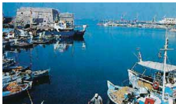
Εικόνα 12.3: Το λιμάνι του Ηρακλείου