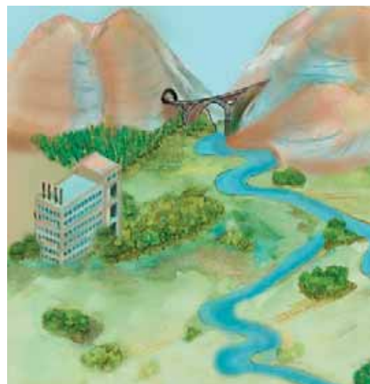
Εικόνα 1.3: Τοπίο σε διαφορετικές χρονικές περιόδους

Παρατηρώντας τις παραπάνω εικόνες ας συζητήσουμε για τις αλλαγές που προκάλεσαν οι άνθρωποι στο τοπίο.