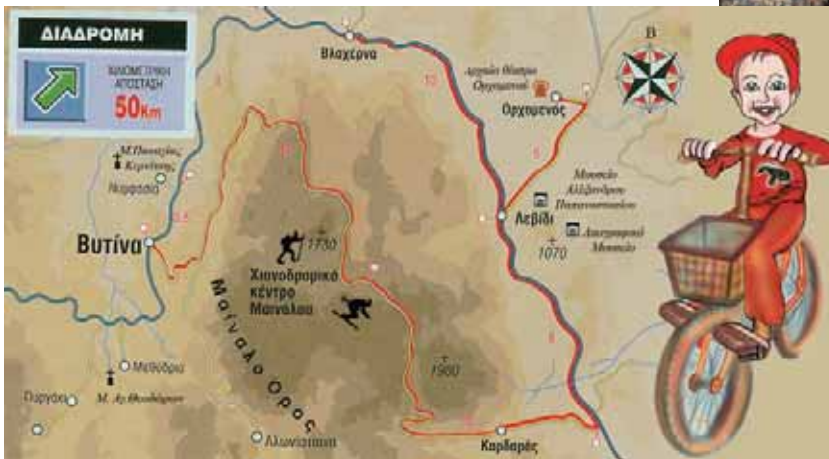
Εικόνα 1.2: Εικόνες από την περιοχή της Βυτίνας