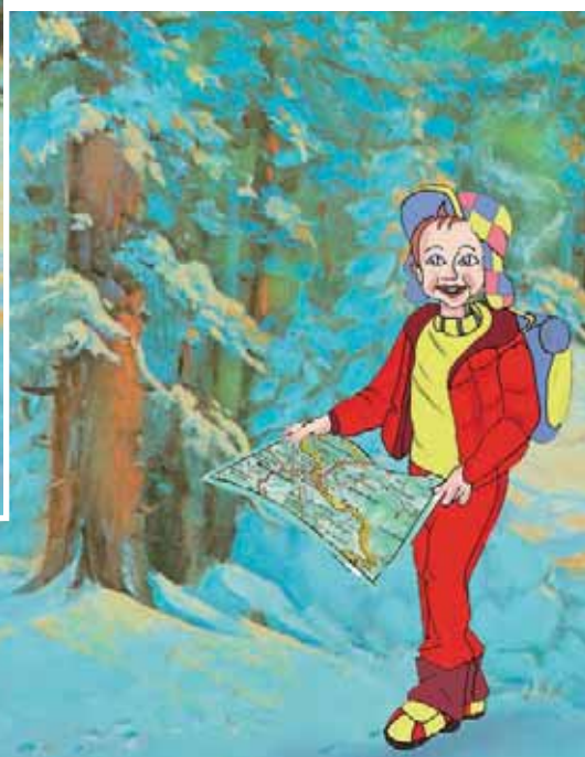
Εικόνα 1.1: Παιδιά εκδρομείς