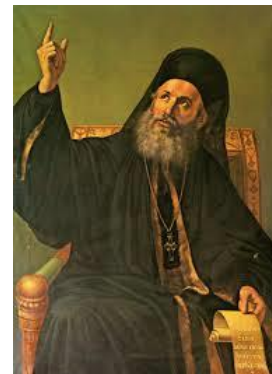
Πατριάρχης Γρηγόριος Ε'

Με την τραγική πτώση της Κωνσταντινούπολης στους Οθωμανούς Τούρκους το 1453 ο πρώτος Πατριάρχης μετά την Άλωση Γεννάδιος Σχολάριος κατόρθωσε να εξασφαλίσει σημαντικές παραχωρήσεις για την Εκκλησία. Στον Πατριάρχη δόθηκε εξουσία όχι μόνο θρησκευτική αλλά και πολιτική καθώς αναγνωρίστηκε ως ανώτατη αρχή όλων των ορθόδοξων λαών που ήταν υποτελείς των Οθωμανών, δηλαδή των Σέρβων, Βουλγάρων, Αλβανών και Ελλήνων. Το Πατριαρχείο κατά τη διάρκεια της Τουρκοκρατίας συνέβαλε όχι μόνο στη διαφύλαξη της ορθόδοξης λειτουργικής και εκκλησιαστικής παράδοσης αλλά και στη διατήρηση της ελληνικής πολιτιστικής κληρονομιάς. Εντούτοις, όταν ξέσπασε η ο Πατριάρχης Γρηγόριος Ε' υπό την πίεση του Σουλτάνου υποχρεώθηκε να αφορίσει τους επαναστάτες. Παρά την ενέργειά του αυτή, την ημέρα του Πάσχα του 1821 απαγχονίστηκε στην κεντρική πύλη του Πατριαρχικού Οίκου, η οποία από τότε παραμένει σφραγισμένη.