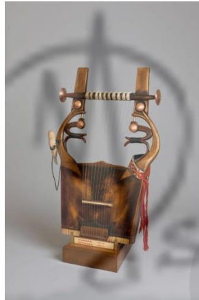
Αρχαία ελληνική κιθάρα, κιθάρα του Απόλλωνα, ή κιθαρίς