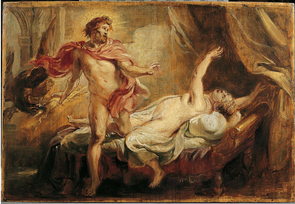
Peter Paul Rubens, Ο Σεμέλη πεθαίνει κεραυνοβλημένη, κατά λάθος, από τον Δία.