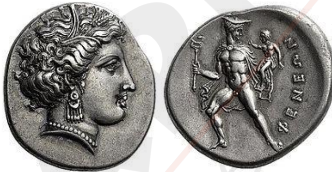
Στατήρας της Φενεού Κορινθίας με απεικόνιση της Δήμητρας - Δηοῦς και του Ερμή.