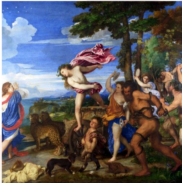
Titiano Vecellio, Ο Διόνυσος και η Αριάδνη στη Νάξο, 1520-22.

Ο Διόνυσος αγαπά ιδιαίτερα τη Θήβα που ήταν η πατρίδα της μητέρας του Σεμέλης. Ο χορός παρακαλεί τον θεό μολεῖν καθαρσίῳ ποδί Παρνασίαν ὑπέρ κλιτύν ἢ στονόεντα πορθμόν , να κατέβει τις πλαγιές του Παρνασσού ή τα στενά περάσματα του πόντου και να έρθει στην πόλη να την λυτρώσει από τον λοιμό.