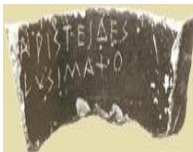
Ο ΕΞΟΣΤΡΑΚΙΣΜΟΣ ΤΟΥ ΩΣ ΑΜΟΙΒΗ