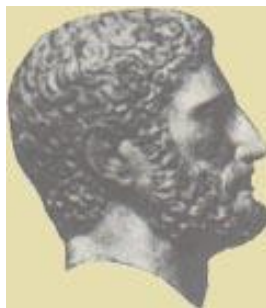
Ο ΔΙΚΑΙΟΣ ΑΡΙΣΤΕΙΔΗΣ