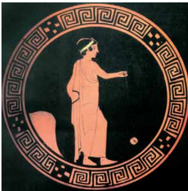
Νεαρό αγόρι με παιγνίδι στο χέρι (ερυθρόμορφη κύλικα, μέσα 5ου αι. π.Χ., Antikenmuseum, Βερολίνο)