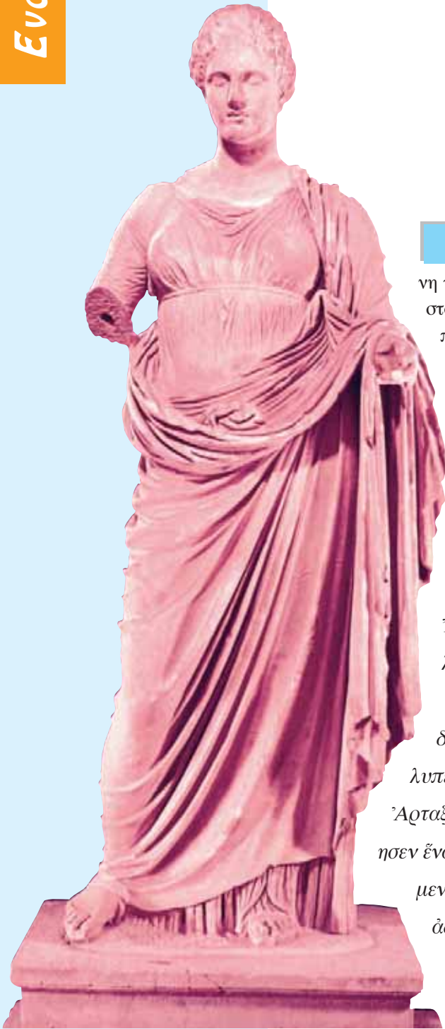
Η θεά Θέμις από τον Ραμνούντα (3ος αι. π.Χ., Εθνικό Αρχαιολογικό Μουσείο Αθήνας)