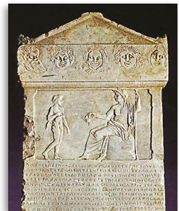
Τιμητικό ψήφισμα για δύο χορηγούς από τον Δήμο της Αιξονής

Για παράδειγμα, πλούσιοι Αθηναίοι αναλάμβαναν την εκπαίδευση και την πληρωμή μιας ομάδας δρομέων για τις λαμπαδηδρομίες που τελούνταν στη διάρκεια των Παναθηναίων (γυμνασιαρχία).