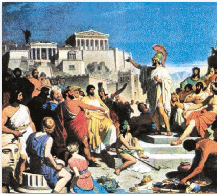
Φ. Φολτς: «Ο Περικλής αγορεύει στην Πνύκα»

► Παρατηρήστε τις εικόνες των αρχαιολόγων, διαβάστε τα κείμενα των ιστορικών, που τις συνοδεύουν και πείτε ποια δικαιώματα και ποιες υποχρεώσεις είχαν οι Αθηναίοι πολίτες.