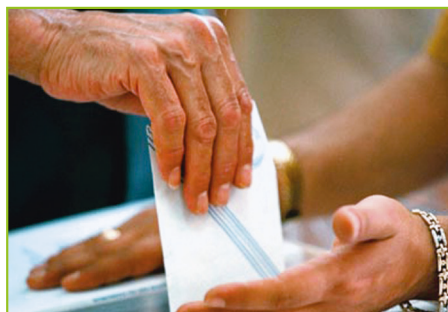
συμμετοχή στις εκλογές

Ο Περικλής θα παρατηρούσε ότι ο Έλληνας πολίτης