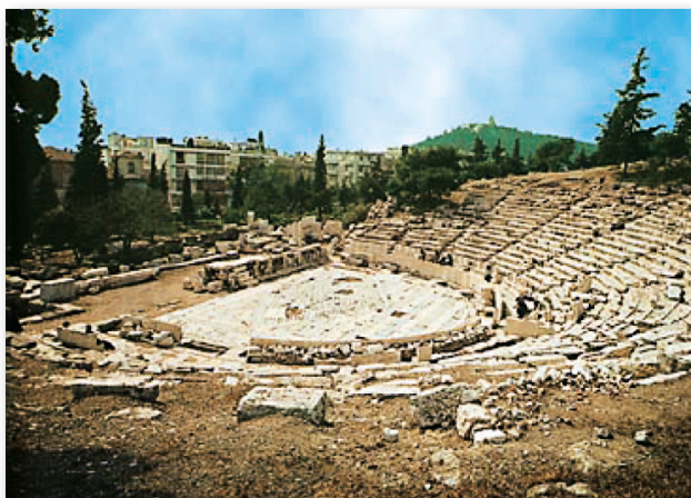
Το θέατρο του Διονύσου στη νότια πλαγιά της Ακρόπολης

Οι Αθηναίοι παρακολουθούσαν πολλές θεατρικές παραστάσεις, επειδή έτσι μορφώνονταν και ψυχαγωγούνταν. Η πόλη της Αθήνας προσέφερε χρήματα στους άπορους πολίτες της, τα λεγόμενα θεωρικά, για να παρακολουθούν κι αυτοί τις παραστάσεις.