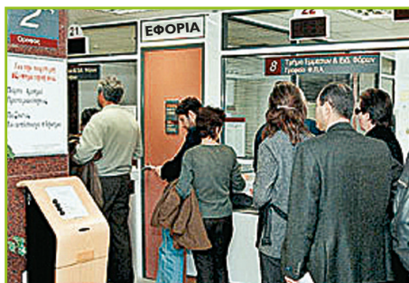
εισφορές στο κράτος

Οι φωτογραφίες που ακολουθούν θα σας βοηθήσουν.