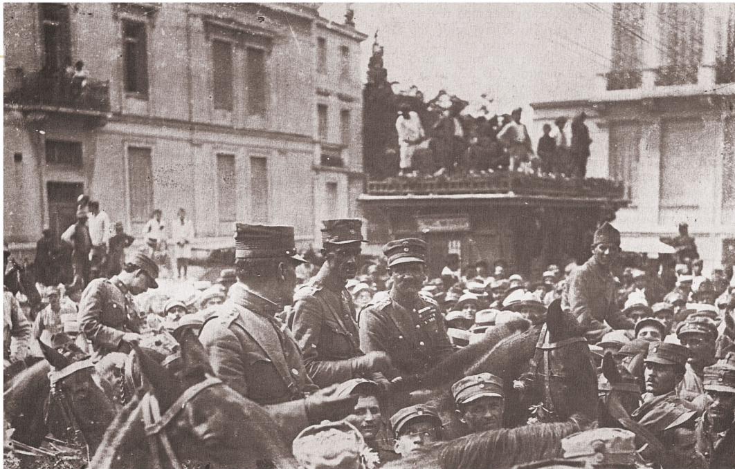
▲ Σεπτέμβριος του 1922. Τμήματα του ελληνικού στρατού εισέρχονται στην Αθήνα

Μετά τη Μικρασιατική Καταστροφή, περισσότεροι από ένα εκατομμύριο πρόσφυγες έφτασαν στην Ελλάδα. Η ανακούφιση και η εγκατάστασή τους ήταν το μεγαλύτερο πρόβλημα που αντιμετώπισε η χώρα την περίοδο του Μεσοπολέμου. Ταυτόχρονα, την ίδια περίοδο στην Ελλάδα επικρατούσε πολιτική και κοινωνική αναταραχή.