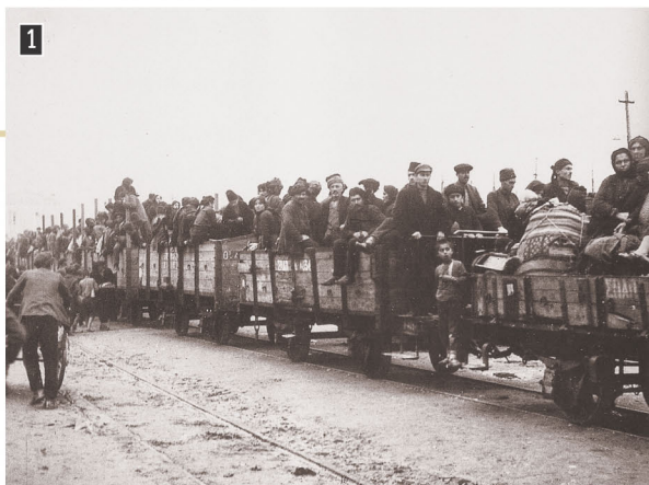
▲ Έλληνες πρόσφυγες φτάνουν στην ηπειρωτική Ελλάδα