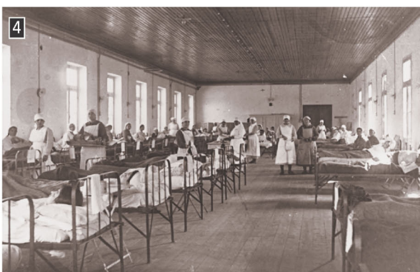
▲ Νοσοκομείο προσφύγων