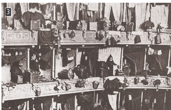
▲ Τους πρώτες μήνες οι πρόσφυγες εγκαταστάθηκαν ακόμη και σε θέατρα