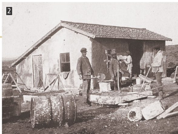
▲ Τυπική προσφυγική κατοικία