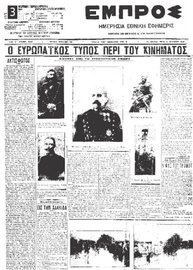
▲ Πρωτοσέλιδο της εφημερίδας Εμπρός για το κίνημα στο Γουδί