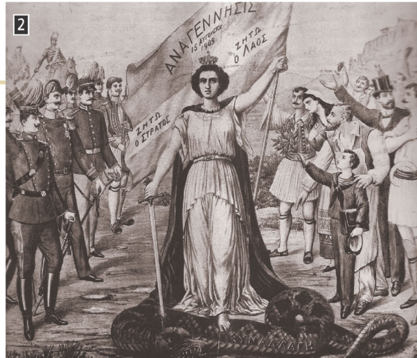
▲ Λαϊκή εικόνα που εξυμνεί το επαναστατικό κίνημα στο Γουδί, Αθήνα, Εθνικό Ιστορικό Μουσείο