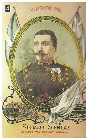
▲ Ο συνταγματάρχης Νικόλαος Ζορμπάς ήταν ένας από τους επικεφαλής του κινήματος στο Γουδί