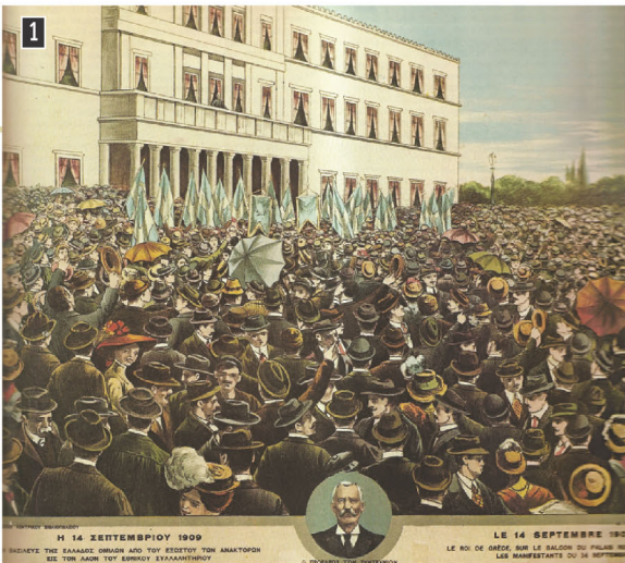
▲ Ο βασιλιάς Γεώργιος μιλά στους εξεγερμένους Αθηναίους, Αθήνα, Εθνικό Ιστορικό Μουσείο