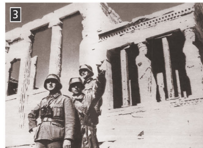
▶ Οι Γερμανοί κατακτητές στην Ακρόπολη