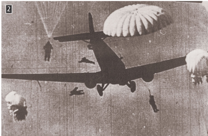
▶ Γερμανοί αλεξιπτωτιστές πέφτουν στην Κρήτη, Αθήνα, Πολεμικό Μουσείο