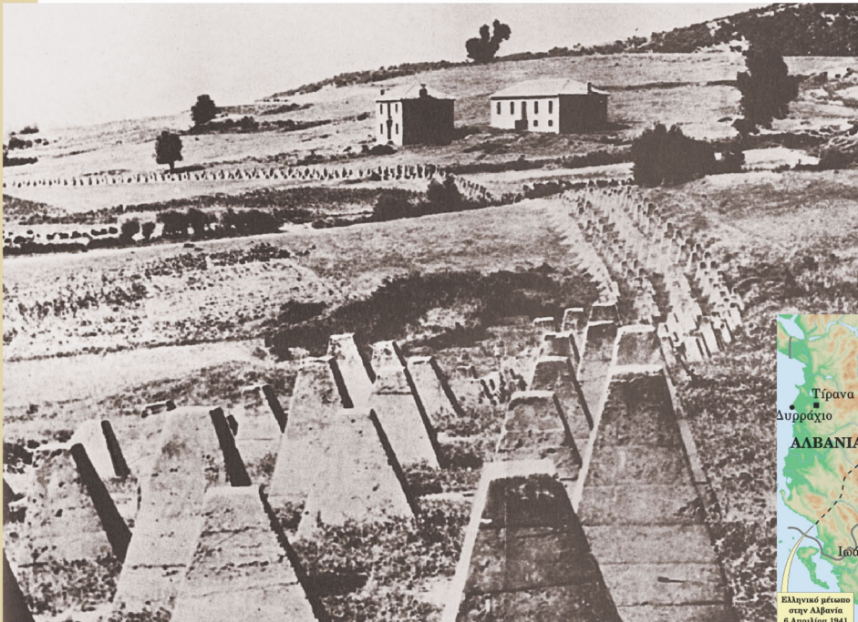
▲ Ανταρματική οχύρωση στην τοποθεσία Μπέφες – Νέστος, Αθήνα, Πολεμικό Μουσείο

Μετά την αποτυχία των Ιταλών να καταλάβουν την Ελλάδα, έσπευσαν να τους βοηθήσουν οι σύμμαχοί τους Γερμανοί. Οι Γερμανοί κατόρθωσαν τελικά να υποτάξουν τους Έλληνες. Ωστόσο, ηττήθηκαν τελικά και οι ίδιοι το 1945 από τις συμμαχικές δυνάμεις.