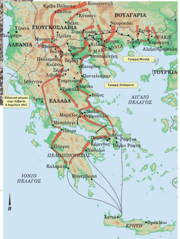
▶ Χάρτης στον οποίο απεικονίζεται η εισβολή των Γερμανών στην Ελλάδα