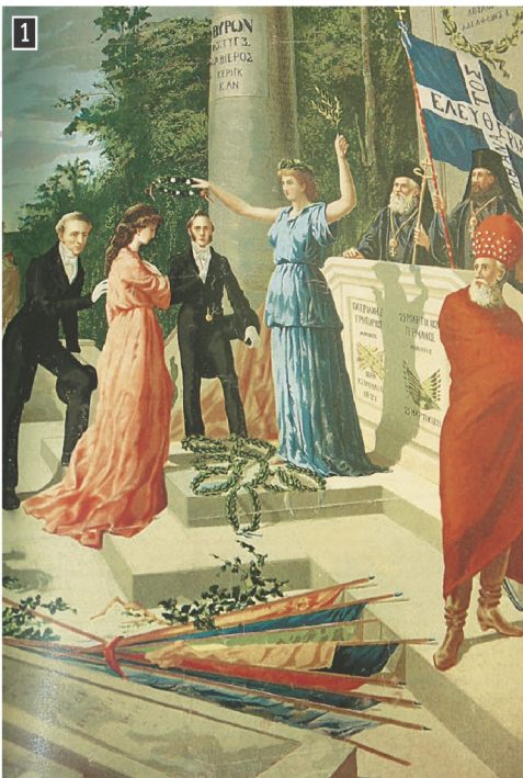
▲ Η παραχώρηση των Επτανήσων στην Ελλάδα, έγχρωμη λαϊκή λιθογραφία