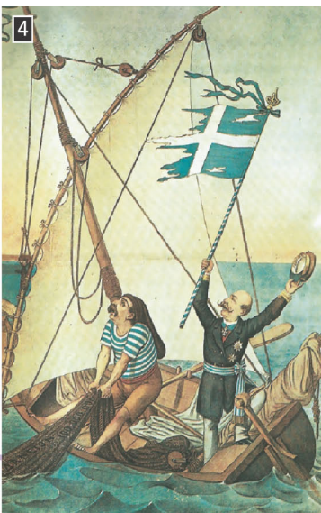
ΤΡΙΚΟΥΠΗΣ ΑΓΩΝΙΖΟΜΕΝΟΣ ΠΡΟΣ ΕΥΡΕΣΙΝ ΔΑΝΕΙΟΥ