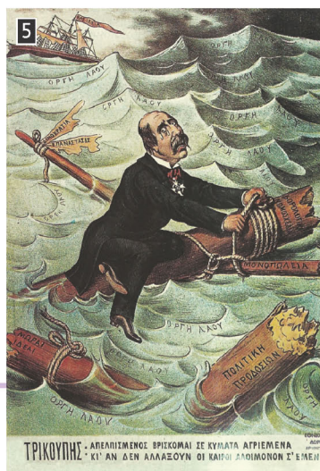
ΤΡΙΚΟΥΠΗΣ - ΑΠΕΛΠΙΣΜΕΝΟΣ ΒΡΙΣΚΟΜΑΙ ΣΕ ΚΥΒΙΛΑ ΑΓΡΙΕΜΕΝΑ ΜΟΝΟΠΩΣΙΑ ΚΙ' ΑΝ ΔΕΝ ΑΛΛΑΞΟΥΝ ΟΙ ΚΑΙΡΟΙ ΔΕΔΟΜΕΝΟΝ Σ' ΕΜΕΙΝ'