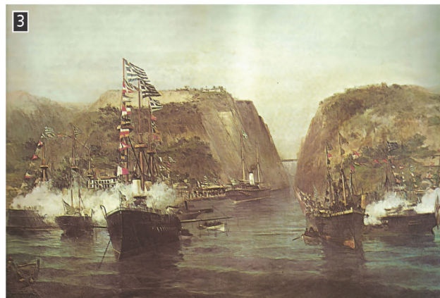
▲ Κωνσταντίνος Βοτανάκης, Η διάνοιξη του Ισθμού της Κορίνθου, Αθήνα, Εθνική Τράπεζα της Ελλάδος