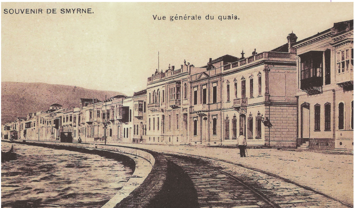
▲ Άποψη της Σμύρνης

Με το πρωτόκολλο που υπέγραψαν στο Λονδίνο οι Μεγάλες Δυνάμεις το 1830, ρυθμίστηκε το ελληνικό ζήτημα και συγκροτήθηκε ανεξάρτητο ελληνικό κράτος. Το Πρωτόκολλο του Λονδίνου όμως δεν ικανοποιούσε όλες τις προσδοκίες των Ελλήνων. Τα σύνορα του νέου κράτους ήταν περιορισμένα, αφήνοντας έξω από τα όριά του πολλούς ελληνικούς πληθυσμούς καθώς και σημαντικές πόλεις, όπου ανθούσε το ελληνικό εμπόριο. Ιδιαίτερα στη Θράκη , στα παράλια της Μικράς Ασίας , στον Πόντο αλλά και στην απομακρυσμένη Καππαδοκία ζούσαν εκατοντάδες χιλιάδες Έλληνες, που ήταν Ορθόδοξοι Χριστιανοί και μιλούσαν την ελληνική, την τουρκική ή την αρμενική γλώσσα.