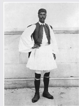
Ο Σπύρος Λούης