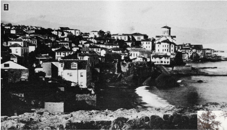
▲ Άποψη της Τραπεζούντας