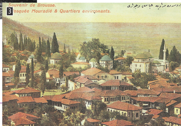
▲ Άποψη της Προύσσας