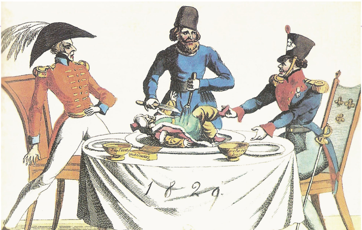
▲ Γελοιογραφία που απεικονίζει τις Μεγάλες Δυνάμεις της εποχής να «κατασπαράζουν» την Οθωμανική Αυτοκρατορία

Στη διάρκεια του 19 ου αιώνα η Οθωμανική Αυτοκρατορία αντιμετώπισε πολλά προβλήματα και άρχισε σταδιακά να χάνει εδάφη. Την ίδια εποχή οι βαλκανικοί λαοί αγωνίζονταν για την ελευθερία τους.