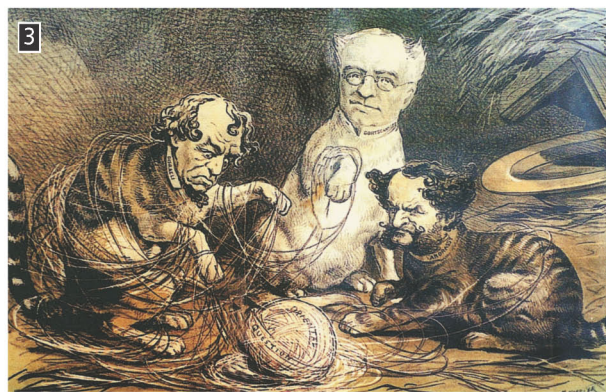
▲ Οι τρεις Μεγάλες Δυνάμεις της εποχής, Αγγλία, Αυστροουγγαρία και Ρωσία, παρομοιάζονται με γάτες που έχουν μπλεχθεί στο κουβάρι που φέρει την ένδειξη Ανατολικό Ζήτημα, Puck, Νέα Υόρκη, 1878