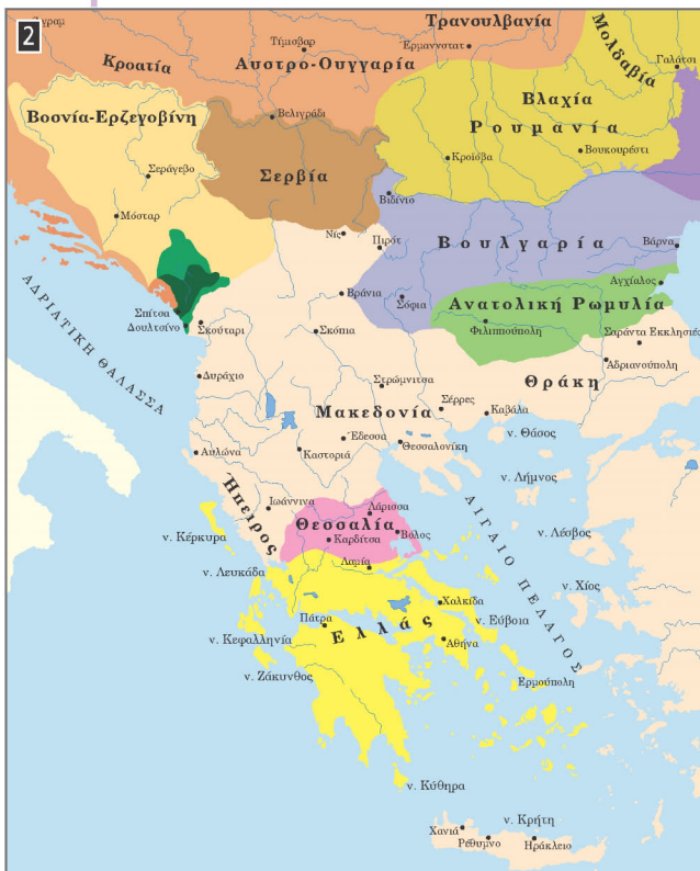
▲ Χάρτης με τις μεταβολές των συνόρων στα Βαλκάνια το δεύτερο μισό του 19 ου αιώνα. Η περιοχή της Θεσσαλίας (ροζ χρώμα) ενσωματώθηκε στην Ελλάδα (κίτρινο χρώμα) το 1881