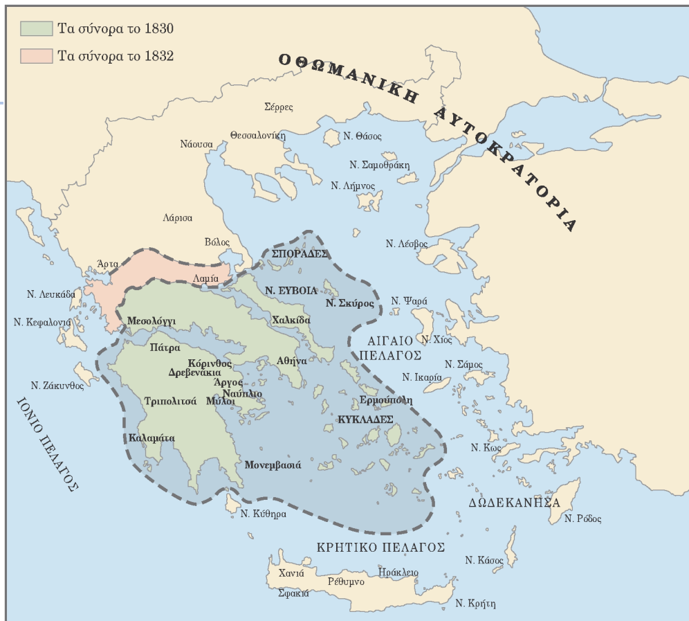
▲ Τα σύνορα του πρώτου ανεξάρτητου ελληνικού κράτους (1830 και 1832)

Μετά τη Ναυμαχία του Ναυαρίνου, οι διπλωματικές ενέργειες για την τύχη της ελληνικής Επανάστασης αυξήθηκαν. Τελικά, τον Φεβρουάριο του 1830 υπογράφηκε στο Λονδίνο Πρωτόκολλο, με το οποίο η Ελλάδα αποκτούσε την ανεξαρτησία της.