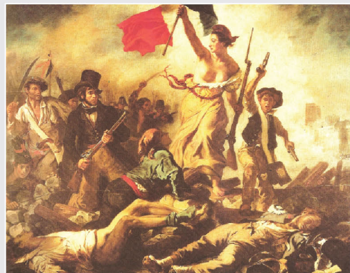
Ευγένιος Ντελακρουά, Η Ελευθερία οδηγεί το λαό, Παρίσι, Μουσείο Λούβρου

Το 1830 ήταν μια χρονιά σημαντικών εξελίξεων, όχι μόνο σε ελληνικό αλλά και σε ευρωπαϊκό επίπεδο. Τον Ιούλιο στη Γαλλία ο λαός ξεσηκώθηκε λόγω της βαθύτατης οικονομικής, κοινωνικής και πολιτικής κρίσης. Οι μνήμες της Γαλλικής Επανάστασης του 1789 ξύπνησαν και οδήγησαν σε καθεστωτική αλλαγή και σε δημοκρατικές μεταρρυθμίσεις. Ο απόηχος της επανάστασης στο Παρίσι έφτασε σε πολλά σημεία της Ευρώπης. Την ίδια χρονιά η Σερβία κέρδισε την αυτονομία της.