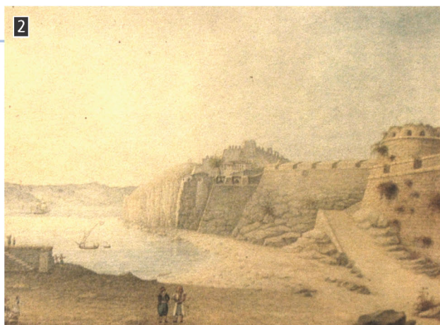
2 ▲ Το Ναύπλιο την εποχή της Απελευθέρωσης, γερμανική λιθογραφία, Αθήνα, Μουσείο της Ιστορικής και Εθνολογικής Εταιρείας