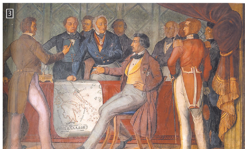
3 ▲ Η Συνθήκη του Λονδίνου. Αίθουσα των Τροπαίων, Βουλή των Ελλήνων