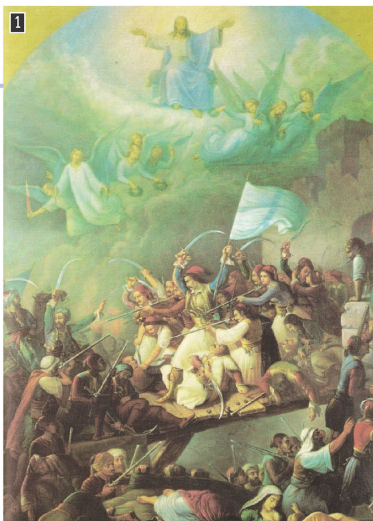
▲ Θ. Βρυζάκης, Η Έξοδος του Μεσολογγίου, Πινακοθήκη Δήμου Μεσολογγίου