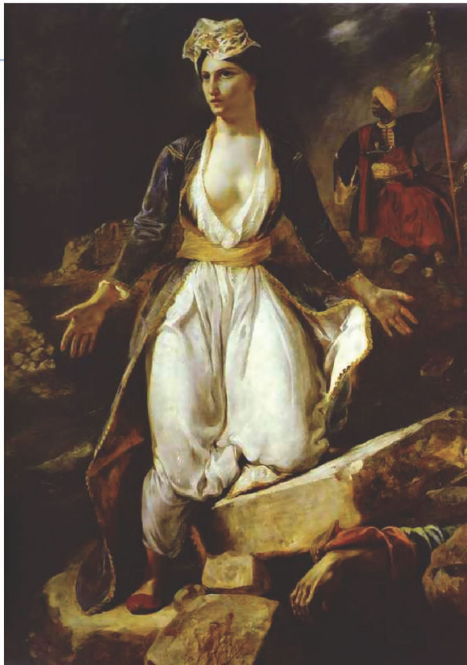
◀ Ευγένιος Ντελακρουά, Η Ελλάδα στα ερείπια του Μεσολογγίου, Αθήνα, Εθνική Πινακοθήκη / Μουσείο Αλεξάνδρου Σούτζου

Τον Απρίλιο του 1825 ξεκίνησε η δεύτερη πολιορκία του Μεσολογγίου αρχικά από τον Κιουταχή και στη συνέχεια από τον Ιμπραήμ Πασά. Παρά την ηρωική αντίσταση των Μεσολογγιτών, η πόλη κυριεύθηκε τον Απρίλιο του 1826. Η έξοδος του Μεσολογγίου στάθηκε μια από τις κορυφαίες στιγμές της ελληνικής Επανάστασης, προκαλώντας βαθιά συγκίνηση σ' ολόκληρο τον κόσμο.