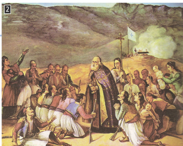
▲ Η μετάληψη των αγωνιστών, αντίγραφο της Πινακοθήκης του Δήμου Μεσολογγίου