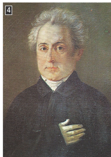
▲ Ο Διονύσιος Σολωμός (1798-1857)