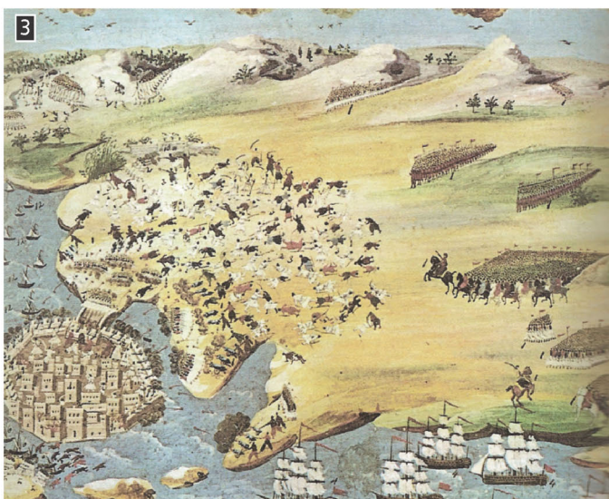
◀ Π. Ζωγράφος, Η πολιορκία του Μεσολογγίου, Αθήνα, Γεννάδειος Βιβλιοθήκη