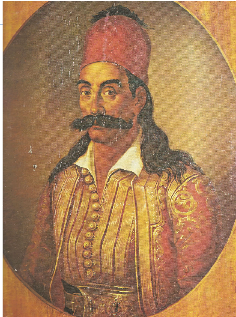
▲ Ο Γεώργιος Καραϊσκάκης, Αθήνα, Εθνικό Ιστορικό Μουσείο

Η πτώση του Μεσολογγίου άνοιξε το δρόμο για την πολιορκία της Ακρόπολης από τον Κιουταχή. Αντιμέτωπός του βρέθηκε ο Γεώργιος Καραϊσκάκης, ο οποίος το φθινόπωρο του 1826 πέτυχε σημαντικές νίκες. Ο θάνατός του όμως, τον Απρίλιο του 1827, οδήγησε στην παράδοση της Ακρόπολης στους Οθωμανούς Τούρκους.