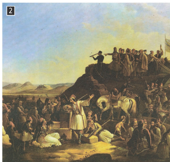
▲ Θ. Βрузάκης, Το στρατόπεδο του Καραϊσκάκη, Αθήνα, Εθνική Πινακοθήκη