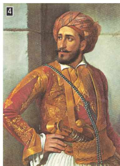
▲ Ο Μακρυγιάννης