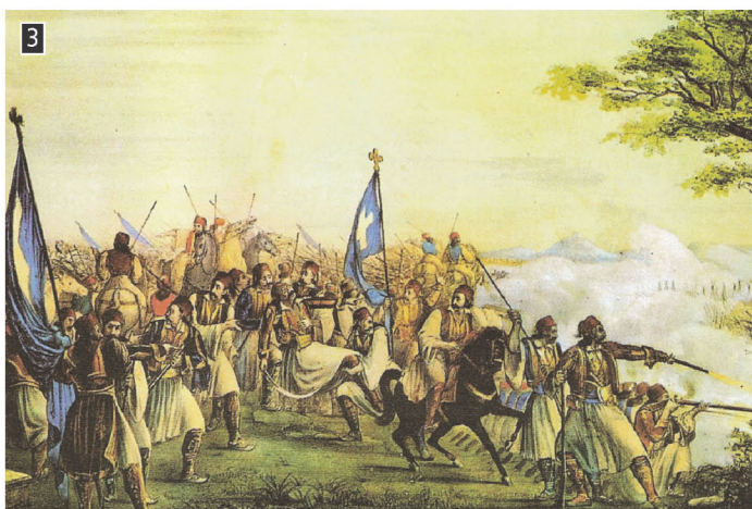
▲ Ο θάνατος του Καραϊσκάκη, Αθήνα, Εθνικό Ιστορικό Μουσείο