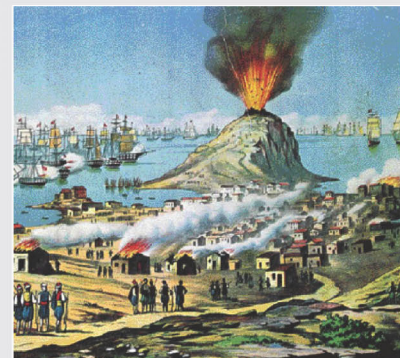
Η καταστροφή των Ψαρών, έργο λαϊκού ζωγράφου, Αθήνα, Εθνικό Ιστορικό Μουσείο

«Στων Ψαρών την ολόμαυρη ράχη Περπατώντας η Δόξα μονάχη Μελετά τα λαμπρά παλληκάρια Και στην κόμη στεφάνι φορεί Γεναμένο από λίγα χορτάρια Που είχαν μείνει στην έρημη γη». Διονύσιου Σολωμού. Άπαντα, τόμ. 1, Ποιήματα , Αθήνα 1993, στ' έκδοση, σ. 139.