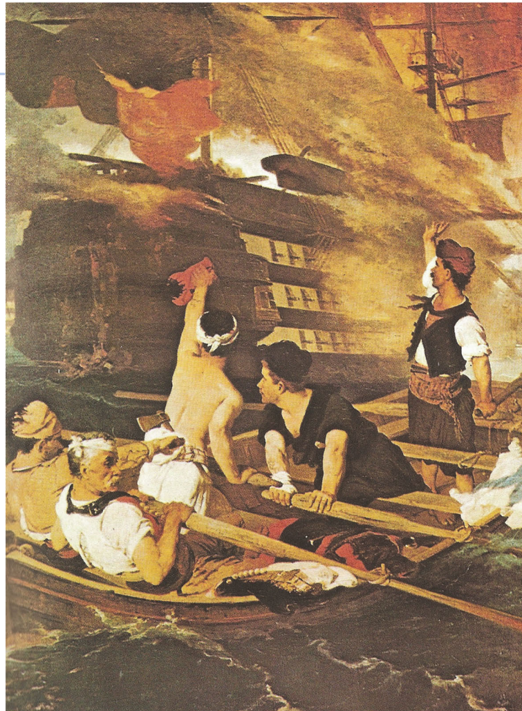
▲ Η πυρπόληση της τουρκικής ναυαρχίδας από τον Κανάρη, πίνακας του Νικηφόρου Λύτρα, Αθήνα, συλλογή Ι. Σερπιέρη

Από τις ναυτικές επιχειρήσεις του ελληνικού στόλου ξεχωρίζουν οι καταδρομικές ενέργειες του Κωνσταντίνου Κανάρη . Ο μπουρλοτιέρης από τα Ψαρά πραγματοποίησε πολλές παράτολμες αποστολές, όπως η πυρπόληση της ναυαρχίδας του τουρκικού στόλου, η οποία μάλιστα ονομαζόταν «Μπουρλότα σαϊμάζι» (καταφρονήτρα των πυρπολικών).