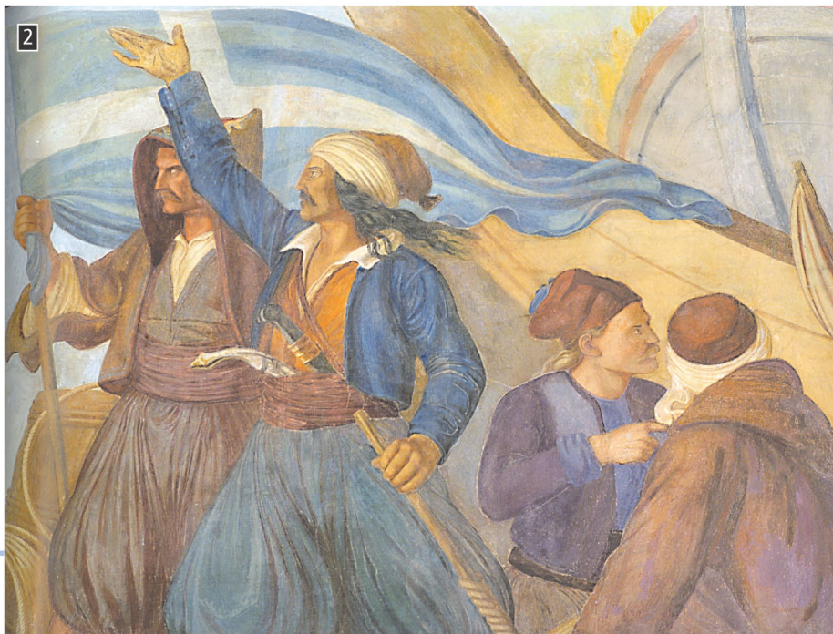
▲ Ο Κανάρης πυρπολεί τον τουρκικό στόλο στη Χίο, λεπτομέρεια από την Αίθουσα των Τροπαίων, Βουλή των Ελλήνων