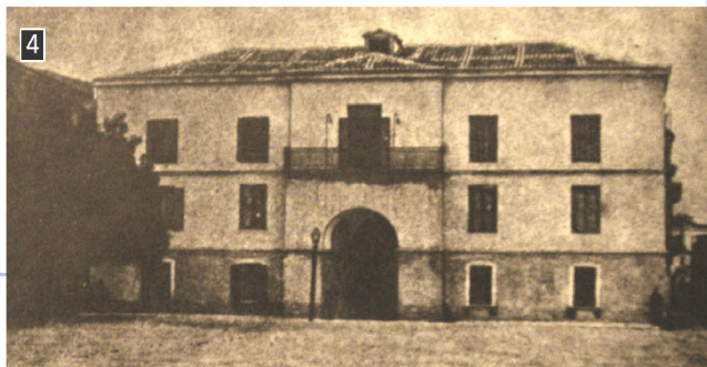
▶ Το Κυβερνείο στο Ναύπλιο, το οποίο έγινε πρωτεύουσα του ελληνικού κράτους το 1828