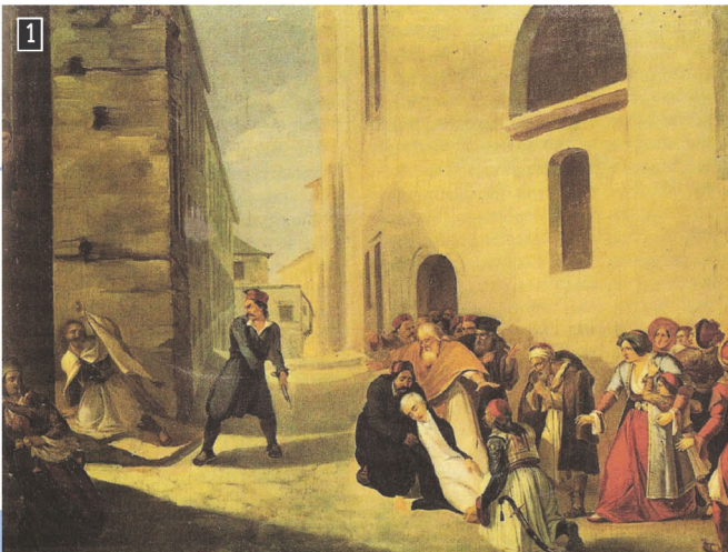
◀ Η δολοφονία του Καποδίστρια, ελαιογραφία του Διονυσίου Τσόκου, Αθήνα, Μουσείο Μπενάκη