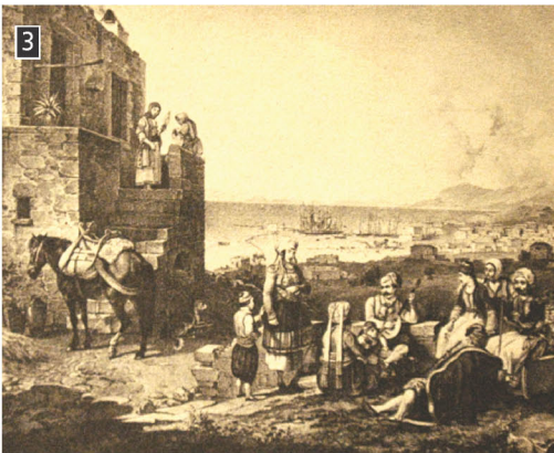
▶ Η Αίγινα την εποχή του Καποδίστρια, λιθογραφία του Fr. Hohe