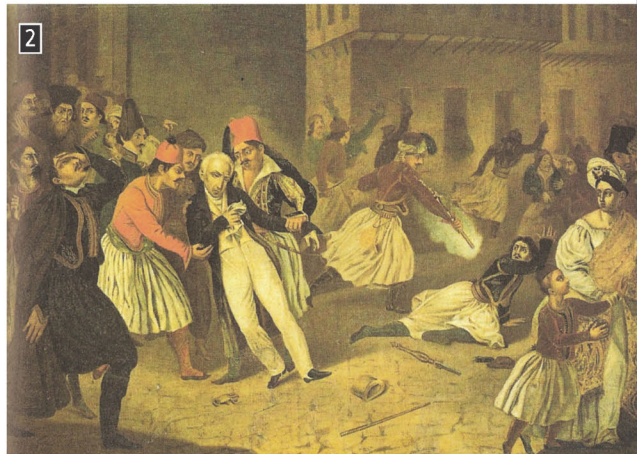
▶ Η δολοφονία του Καποδίστρια, έργο αγνώστου ζωγράφου, Αθήνα, Μουσείο Μπενάκη