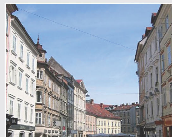
Άποψη της Λουμπλιάνας σήμερα

Του ανέφερε επίσης πως η Ρωσία ζούσε ειρηνικά με την Οθωμανική Αυτοκρατορία και πως δεν επρόκειτο για χάρη του να έρθει σε ρήξη μαζί της. Το Συνέδριο της Ιερής Συμμαχίας στο Λάιμπαχ καταδίκασε κάθε επαναστατική κίνηση στην Ευρώπη.