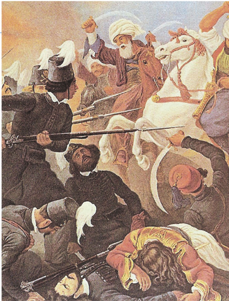
▲ Η καταστροφή του Ιερού Λόχου, πίνακας του Πέτερ φον Es, Αθήνα, Γεννάδειος Βιβλιοθήκη

Τον Φεβρουάριο του 1821 ο υπασπιστής του Ρώσου τσάρου, Αλέξανδρος Υψηλάντης, ηγήθηκε της εξέγερσης εναντίον των Τούρκων στη Μολδοβλαχία. Ωστόσο, μετά από επτά μήνες, η εξέγερση καταπνίγηκε από τον οθωμανικό στρατό.