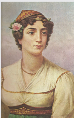
Η Μαντώ Μαυρογένους

Στην Επανάσταση του 1821 εξίσου σημαντική υπήρξε και η συμβολή των γυναικών, οι οποίες βοήθησαν με κάθε τρόπο. Η Μαντώ Μαυρογένους διέθεσε την πατρική της περιουσία στον Αγώνα, ενώ η Σπετσιώτισσα καπετάνισσα Λασκαρίνα Μπουμπουλίνα συμμετείχε με τα καράβια της σε διάφορες πολεμικές επιχειρήσεις εναντίον των Τούρκων.