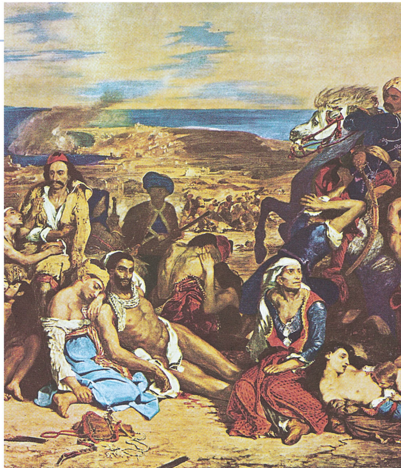
▲ Ευγένιος Ντελακρουά, Η σφαγή της Χίου, Παρίσι, Μουσείο Λούβρου

Η επανάσταση διαδόθηκε γρήγορα στα νησιά του Αιγαίου. Σπουδαίοι ναυτικοί, όπως ο Ανδρέας Μιαούλης και ο Δημήτριος Παπανικολής, προσέφεραν σημαντικές υπηρεσίες, είτε μεταφέροντας τρόφιμα και πολεμοφόδια στην Πελοπόννησο και τη Στερεά Ελλάδα είτε προστατεύοντας τις παραπάνω περιοχές από τις επιθέσεις του τουρκικού στόλου.