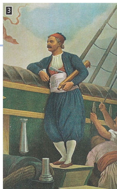
▲ Ο Ανδρέας Μιαούλης