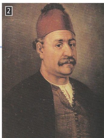
▲ Ο Ανδρέας Μιαούλης