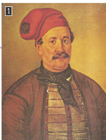
▲ Ο Δημήτριος Παπανικολής