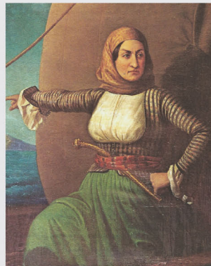
Η Λασκαρίνα Μπουμπουλίνα