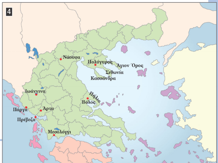
▶ Η Επανάσταση στις άλλες εστίες του Ελληνισμού