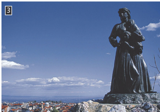
◀ Φωτογραφία του αγάλματος προς τιμήν των γυναικόπαιδων της Νάουσας που έχασαν τη ζωή τους το 1822