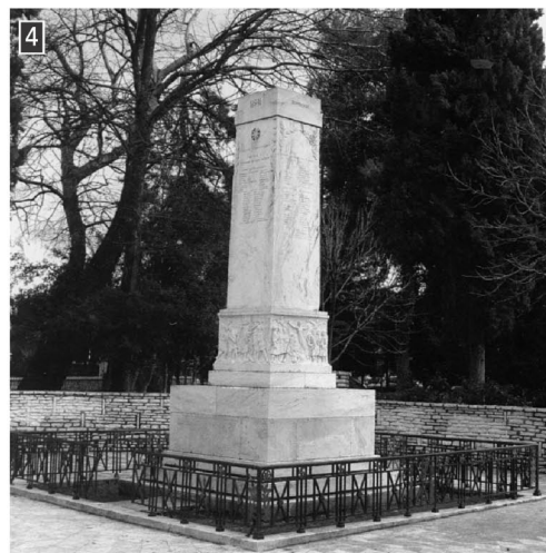
▲ Μνημείο των Ηρώων στην Πλατεία Άρεως στην Τρίπολη