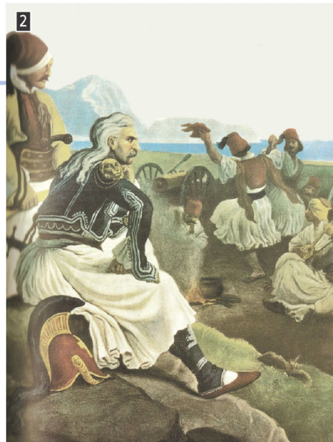
▲ Ο Κολοκοτρώνης παρατηρεί τους άνδρες του που διασκεδάζουν, σύνθεση του Πέτερ φον Ες