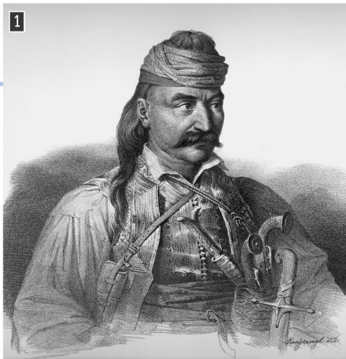
▲ Ο Θεόδωρος Κολοκοτρώνης