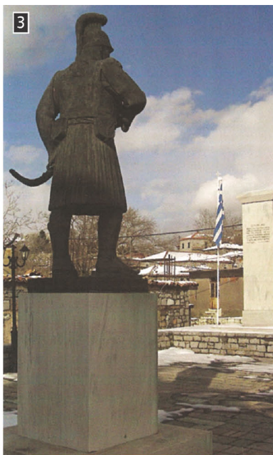
▲ Μνημείο της μάχης στο Βαϊτέτσι