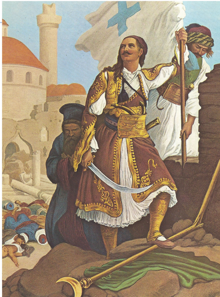
▲ Η ελληνική σημαία υψώνεται στην Τριπολιτσά, ζωγραφική αναπαράσταση από τον Πέτερ Φον Ες

Οι Έλληνες επαναστάτες στην Πελοπόννησο με επικεφαλής τον Θεόδωρο Κολοκοτρώνη αποφάσισαν να πολιορκήσουν την Τριπολιτσά, που ήταν η στρατιωτική έδρα των Τούρκων στην περιοχή. Η άλωσή της, τον Σεπτέμβριο του 1821, τόνωσε το ηθικό των Ελλήνων.