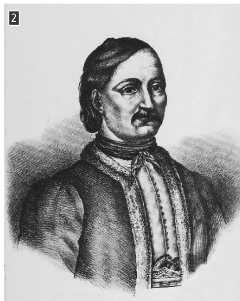
▲ Ο Ιωάννης Κωλήττης