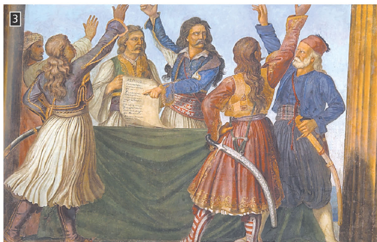
▲ Η Εθνική Συνέλευση στην Επίδαυρο, Αίθουσα των Τροπιάων, Βουλή των Ελλήνων