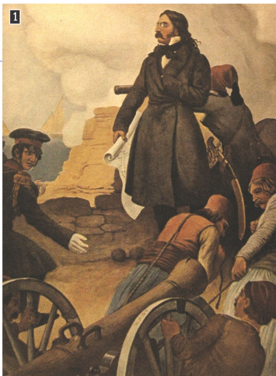
▲ Ο Αλέξανδρος Μαυροκορδάτος, λιθογραφία του Πέτερ φον Ες