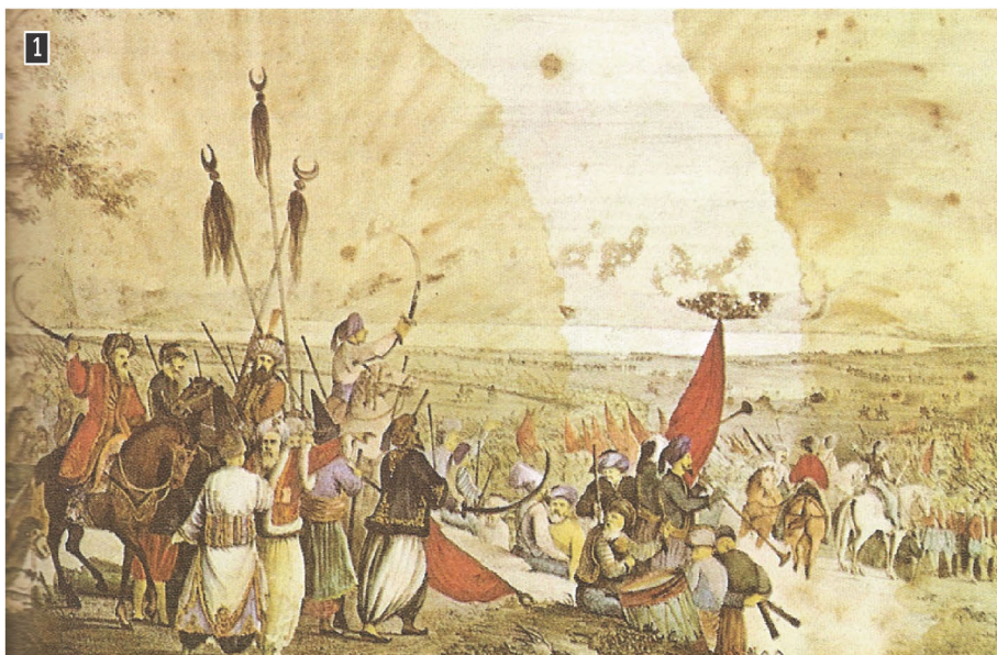
▲ Αλέξανδρος Ησαΐας, Η εκστρατεία του Δράμαλη στην πεδιάδα του Άργους, Αθήνα, Εθνικό Ιστορικό Μουσείο