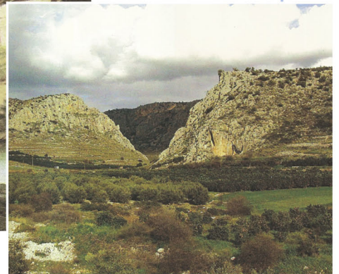
▲ Τα Δερβενάκια σήμερα