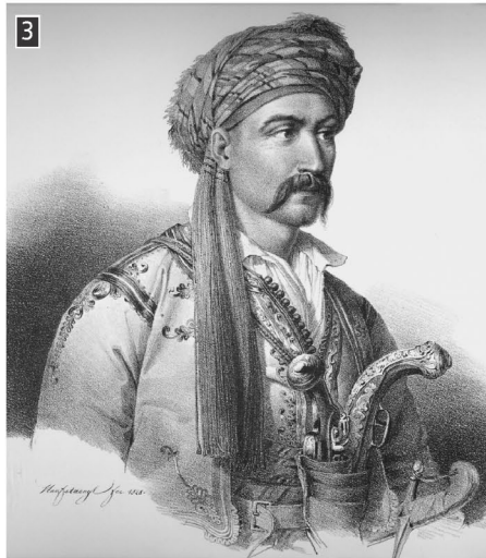
▲ Ο Νικηταράς