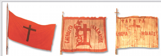
Η πρώτη ελληνική επαναστατική σημαία (αριστερά), πολεμική σημαία των Σπετσών (μέση), πολεμική σημαία των Ψαρών (δεξιά)

Στη διάρκεια της Επανάστασης του 1821 δεν χρησιμοποιήθηκε ένα είδος σημαίας. Αντίθετα, κάθε καπετάνιος και κάθε περιοχή συνήθιζαν να έχουν τη δική τους σημαία. Σ' αυτές δέσποζε κατά κανόνα το σημείο του Σταυρού καθώς και το σύνθημα «Ελευθερία ή Θάνατος». Η σημερινή ελληνική σημαία καθιερώθηκε το 1822 από το Σύνταγμα της Επιδάουρου, έχοντας βεβαίως υποστεί με το πέρασμα του χρόνου ορισμένες τροποποιήσεις, λόγω των συνταγματικών αλλαγών στο πολίτευμα της χώρας.