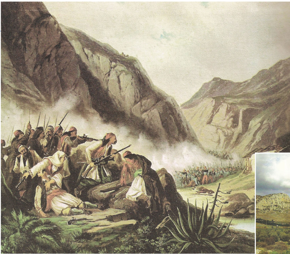
▲ Θεόδωρος Βρυζάκης, Η μάχη στα Δερβενάκια

Οι αρχικές επιτυχίες των Ελλήνων επαναστατών θορύβησαν την Υψηλή Πύλη. Την άνοιξη του 1822 στάλθηκε στη Στερεά Ελλάδα, επικεφαλής πολυάριθμης στρατιωτικής δύναμης, ο Δράμαλης με σκοπό να καταστείλει την Επανάσταση. Παγιδεύτηκε όμως και γνώρισε βαριά ήττα στα Δερβενάκια, στις 26 Ιουλίου του 1822.