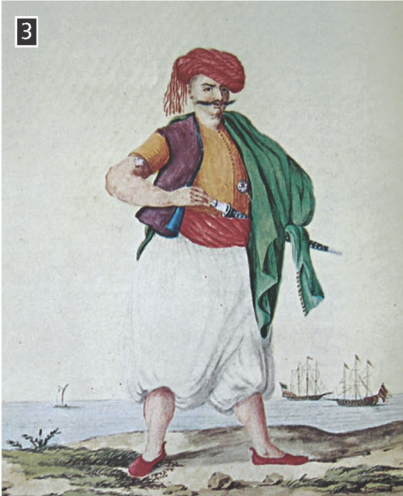
▲ Έλληνας ναυτικός, Αθήνα, Γεννάδειος Βιβλιοθήκη