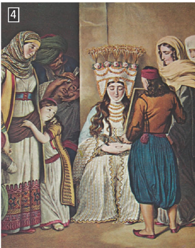
▲ Αθηναία νύφη ετοιμάζεται για τον γάμο, Αθήνα, Γεννάδειος Βιβλιοθήκη