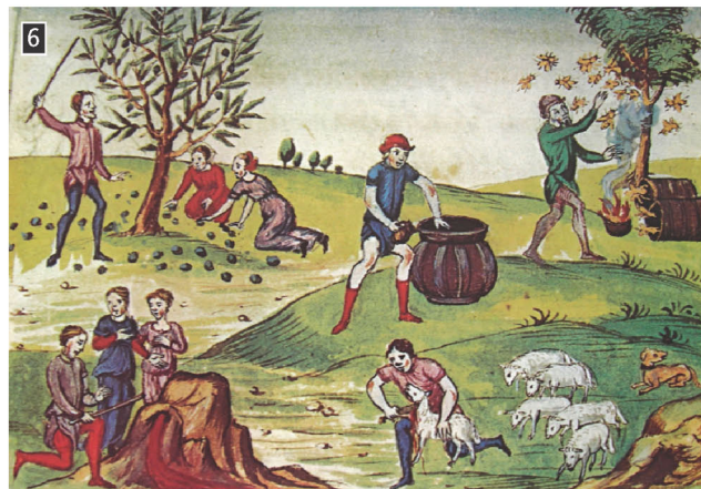
▲ Σκηνή από την αγροτική ζωή, Παρίσι, Εθνική Βιβλιοθήκη