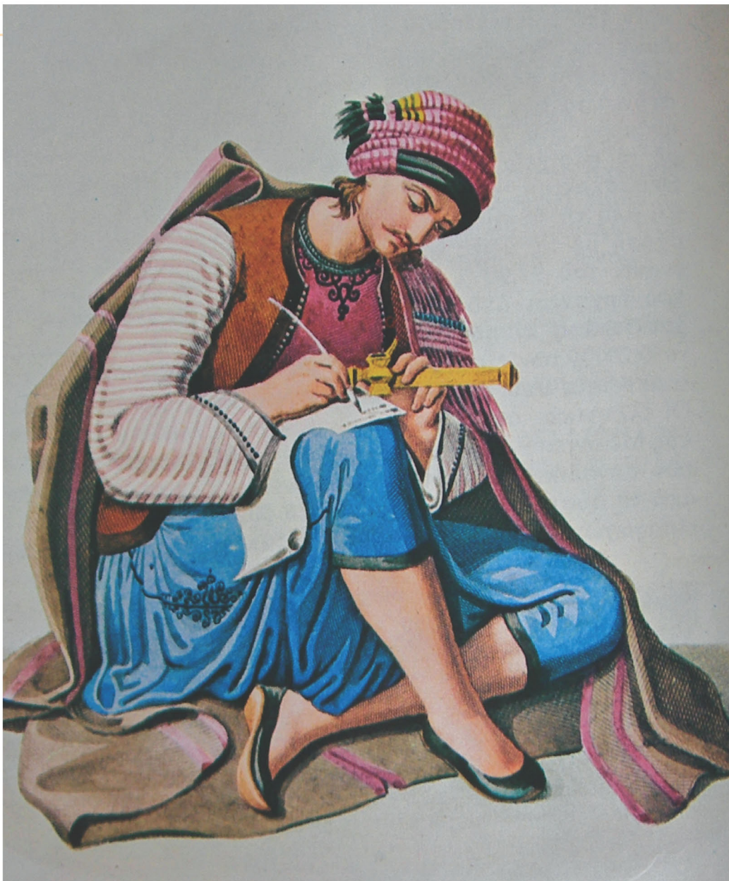
▲ Έλληνας έμπορος, λιθογραφία, Αθήνα, Γεννάδειος Βιβλιοθήκη

Η σταδιακή παρακμή της Οθωμανικής Αυτοκρατορίας έδωσε τη δυνατότητα στους υπόδουλους Έλληνες να αναπτύξουν οικονομική δραστηριότητα, κυρίως εμπορική και να πλουτίσουν από αυτήν. Οι εμπορικές σχέσεις με τη Δύση τους έφεραν σε επαφή και με τις επαναστατικές ιδέες του τέλους του 18 ου αιώνα στη Δυτική Ευρώπη.