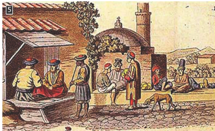
▲ Παζάρι στην πόλη της Λάρισσας