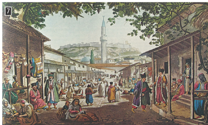
▲ Ζωγραφική απεικόνιση της αθηναϊκής αγοράς κοντά στη βιβλιοθήκη του Αδριανού, Αθήνα, Γεννάδειος Βιβλιοθήκη