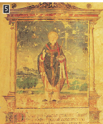
▲ Ο άγιος Νικόλαος, προστάτης της Αδελφότητας των Ελλήνων Ορθοδόξων της Βενετίας