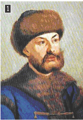
▲ Αλέξανδρος Μαυροκορδάτος, ο εξ απορρήτων