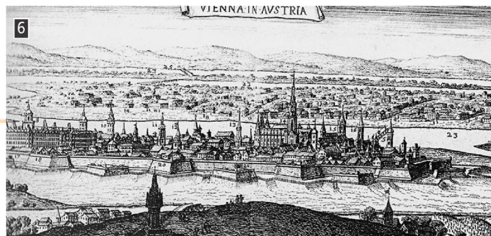
▲ Η Βιέννη