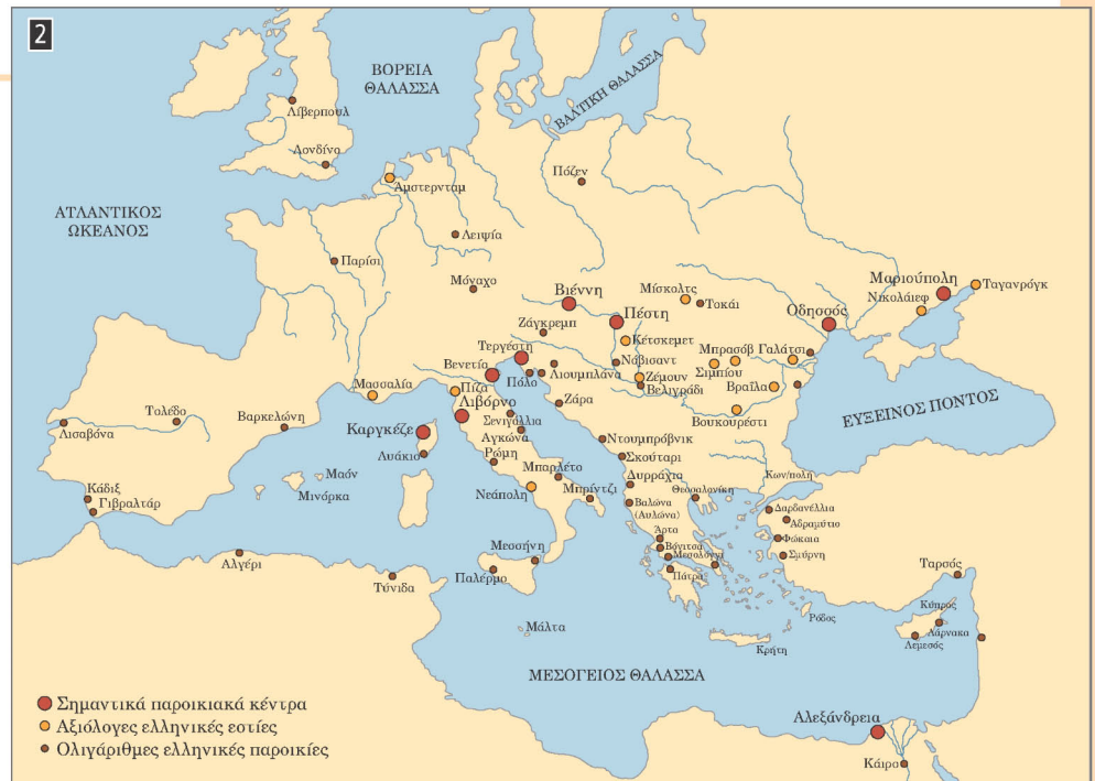
▲ Τα σημαντικότερα κέντρα της ελληνικής Διασποράς κατά την περίοδο της Τουρκοκρατίας, Όλγα Κατσαρδής-Heiring, Ιω. Χοσιώτης, Ευρυδίκη Αμπατζή (επιμ.), Οι Έλληνες στη Διασπορά (15 ος -21 ος αι.) , Αθήνα 2006, σ. 12