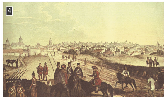
▲ Αποψη του Βουκουρεστίου κατά τον 18 ο αιώνα