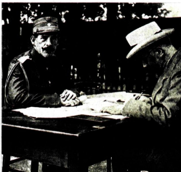
Ο Ελευθέριος Βενιζέλος και ο Κωνσταντίνος στο ελληνικό στρατιωτικό στο Χατζή-Μπειλί, μετά τη σύναψη ανακωχής με τη Βουλγαρία και πριν από τη μετάβαση του Έλληνα πρωθυπουργού στο Βουκουρέστι. Γεννάδειος Βιβλιοθήκη, Αθήνα.

δυνάμεις, και αξίωσε από τον Τούρκο διοικητή Χασάν Ταχσίν πασά την παράδοση της πόλης την 27η Οκτωβρίου (π.η.). Πράγματι ο Τούρκος διοικητής παρέδωσε την πόλη στους Έλληνες πολιορκητές, όταν δε έφτασαν εν σπουδή ισχυρές βουλγαρικές στρατιωτικές δυνάμεις και ζήτησαν να παραδοθεί και στους Βουλγάρους η πόλη, ο Χασάν Ταχσίν πασάς απάντησε πως η Θεσσαλονίκη είχε ήδη αλλάξει κυρίαρχο. Στις 22 Φεβρουαρίου/7 Μαρτίου 1913 οι Τούρκοι, ύστερα από νέες ήττες, παρέδωσαν τα Ιωάννινα στους Έλληνες και την Αδριανούπολη στους Βουλγάρους, ενώ τον Απρίλιο παρέδωσαν τη Σκόδρα στους Σέρβους.