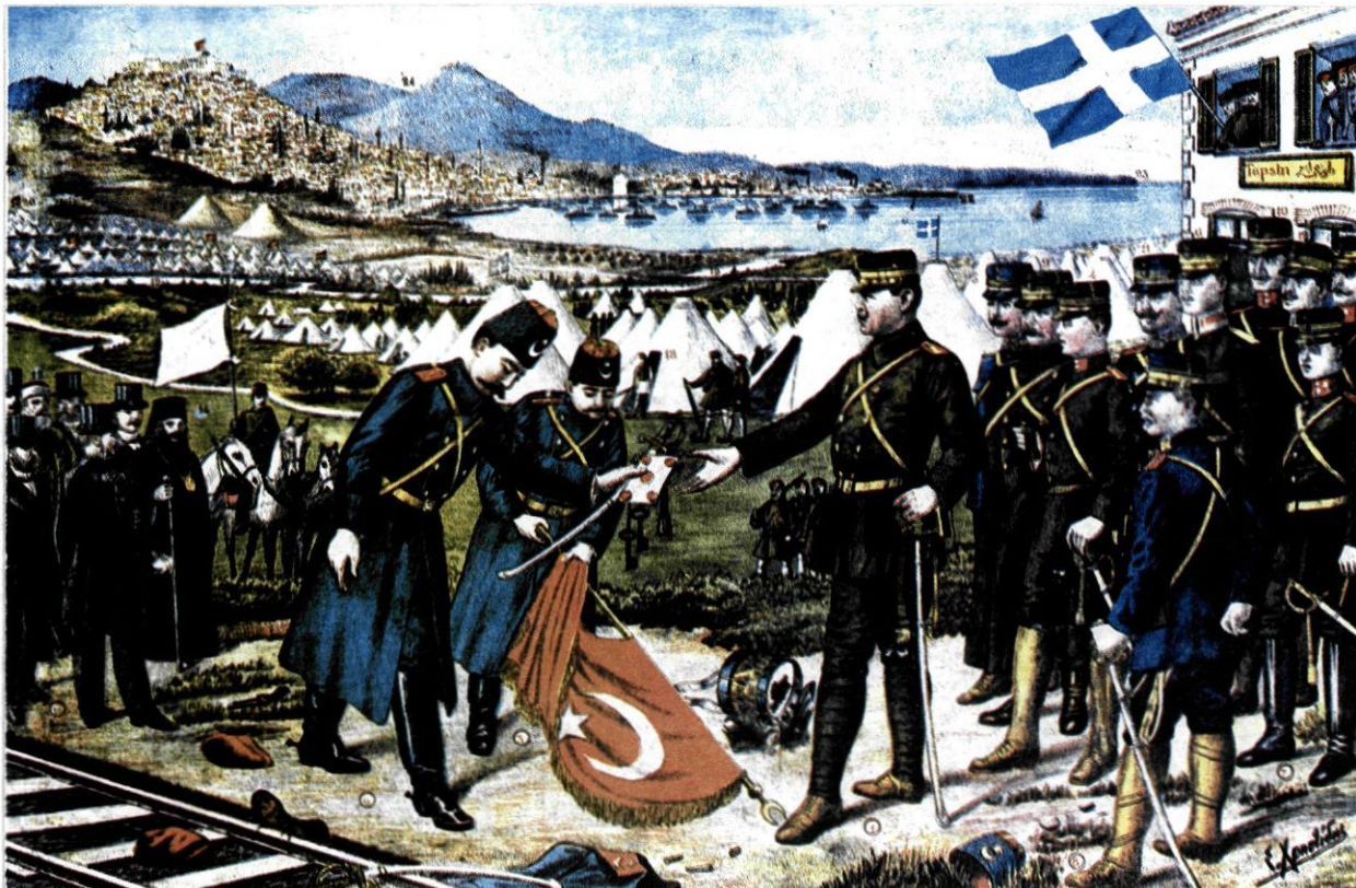
Λαϊκή λιθογραφία που απεικονίζει την παράδοση της Θεσσαλονίκης στον διάδοχο Κωνσταντίνο, επικεφαλής του ελληνικού στρατού, από τον Τούρκο Ταχσίν πασά (27 Οκτωβρίου 1912). Η ταχεία ελληνική προέλαση προς τη Θεσσαλονίκη απέτρεψε την είσοδο των Βουλγάρων στην πόλη. Συλλογή Ιστορικής και Εθνολογικής Εταιρείας της Ελλάδος.