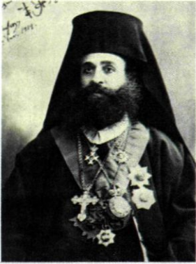
Ο Γερμανός Καραβαγγέλης (1867-1936), μητροπολίτης Καστοριάς από το 1900, ανέλαβε την οργάνωση ένοπλων σωμάτων από ντόπιους στην περιφέρεια της μητρόπολής του και τόνωσε το εθνικό φρόνημα των Ελλήνων της Μακεδονίας.