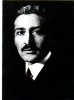
Ο Ιωάν Δραγούμης (1878-1920), συγγραφέας, πολιτικός και διπλωμάτης, διατέλεσε υποπρόξενος της Ελλάδας στο Μοναστήρι και ενίσχυσε σημαντικά την ελληνική αντίσταση στις βουλγαρικές ενέργειες.